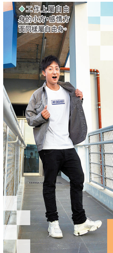
◆工作上屬自由身的小方，感情方面同樣屬自由身。