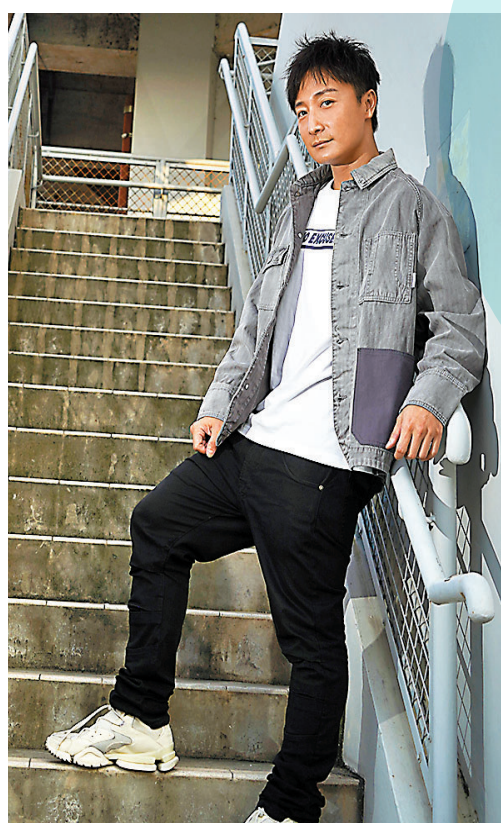
◆小方靠人生經驗及睇電影作參考來揣摩角色。

Make up: Yen Lai Hair: Kin Tam @ ILCoplo Outfit: 5cm