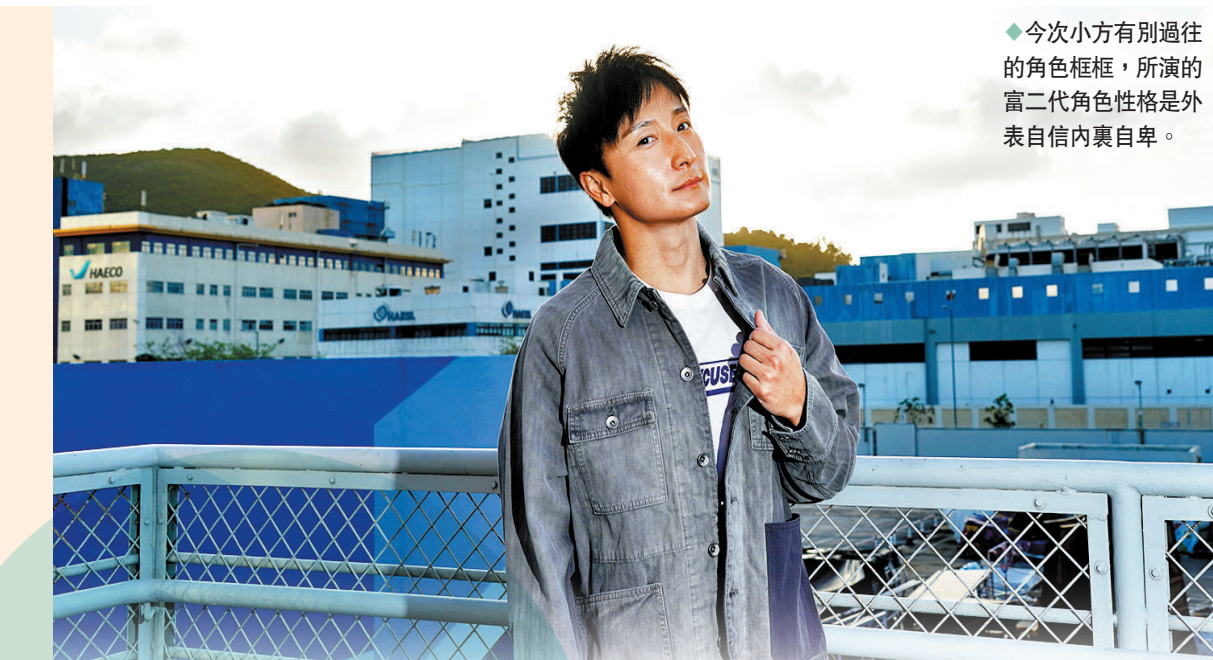
◆今次小方有別過往的角色框框，所演的富二代角色性格是外表自信內裏自卑。