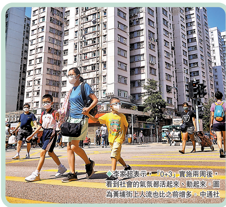
◆李家超表示,「0+3」實施兩周後,看到社會的氣氛都活起來、動起來。圖為黃埔街上午人流也比之前增多。

另外,全國政協副主席梁振英11日在一個研討會上表示,不少人盼望入境檢疫「0+3」措施放寬至「0+0」,可以吸引外國企業及投資者重回香港,他認為這是重要因素,但不是全部因素;更重要的是向海外加強宣傳,釋解疑慮。