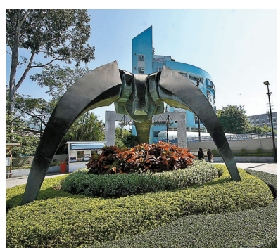
◆賽馬會體藝中學籃球隊有聚集感染需要停課。圖為賽馬會體藝中學。資料圖片

針或完成疫苗接種,接近80%民眾已接種第三針。在大部分民眾已經接種疫苗的情況下,仍然有約15%的民眾重複感染,香港會否也出現同樣情況?