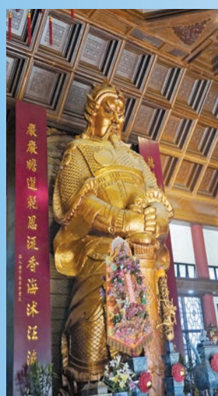
香港車公廟內車公神像。

深圳的車公廟位於深圳市福田区，因古建築車公廟得名。如今，深圳的車公廟是深圳最繁忙的地鐵站