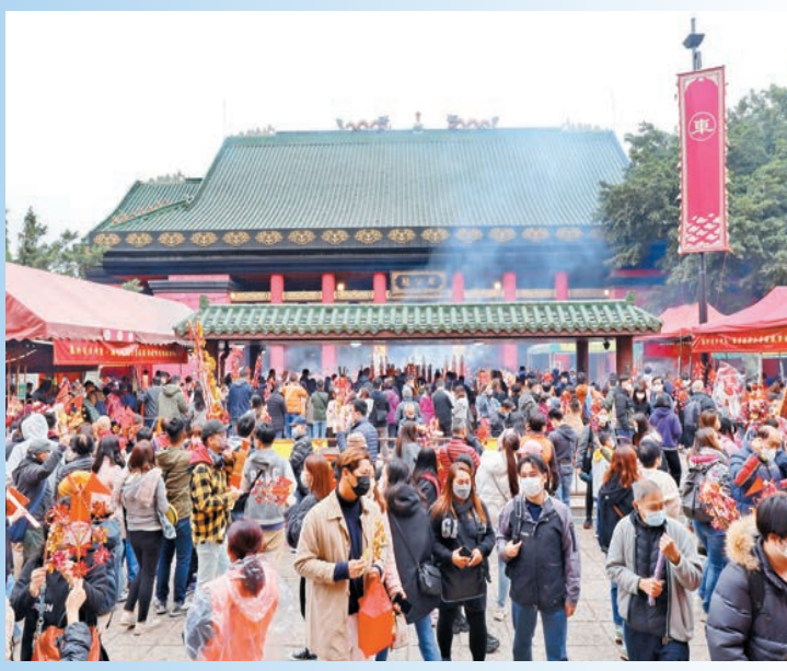
農曆年初三，香港車公廟人頭湧湧。