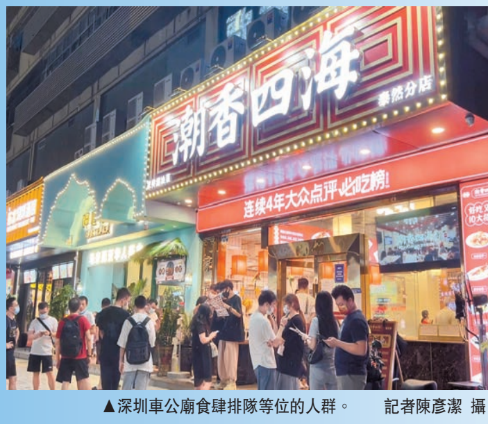
深圳車公廟食肆排隊等候的人群。