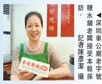
深圳車公廟老字號糖水舖老闆接受本報採訪。