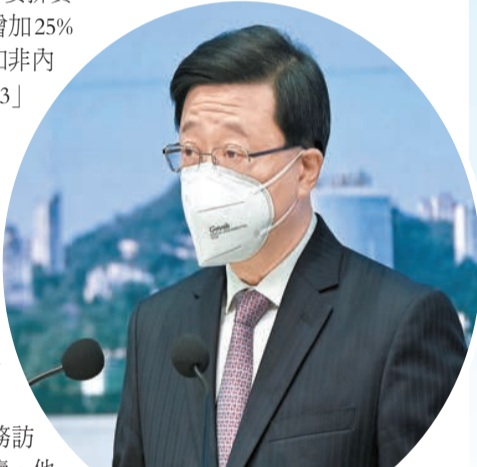
李家超指出，抗疫路線清晰，放寬須留意相關數據。

香港。他稱，更有人不守規矩，破壞香港市民的抗疫努力，包括不遵守「紅碼」及「黃碼」要求、使用假「免針紙」、不遵守強制檢測公告等。