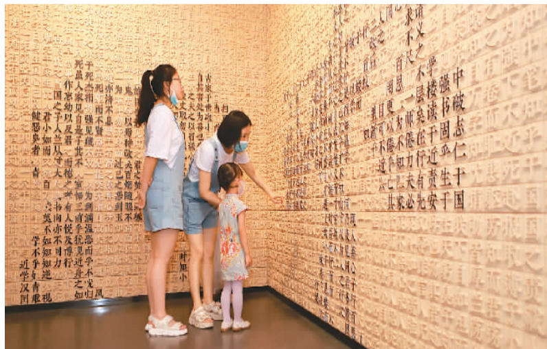
家长带着孩子参观四川客家家风馆。

自2019年3月开馆以来，四川客家家风馆共接待团体参访650余批次、3万余人，其他游客34万余人次，成为古镇重要文化地标和游客打卡点，形成了廉洁文化建设与地方文旅产业发展同频共振效应。