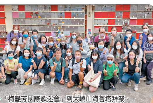
◆ 「梅艷芳國際歌迷會」到大嶼山海苔塔拜祭。