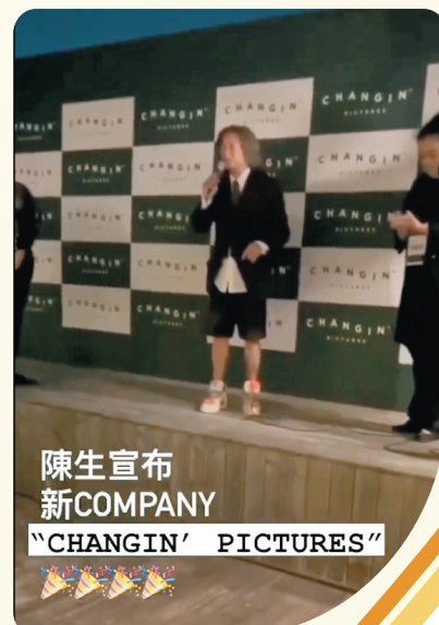
陳生宣布新COMPANY "CHANGIN' PICTURES"