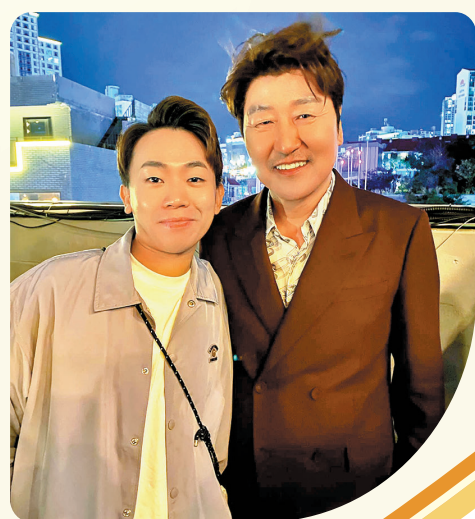
◆ 岑珈其與自己偶像宋康昊合照。

據介紹 Changin' Pictures 是一個泛亞洲製作公司，目前已經確定了製作韓國、中國香港、中國台灣、泰國、日本五個地區的劇集項目，這其中包括陳可辛執導，章子怡出演的懸疑劇《The Murderer》。