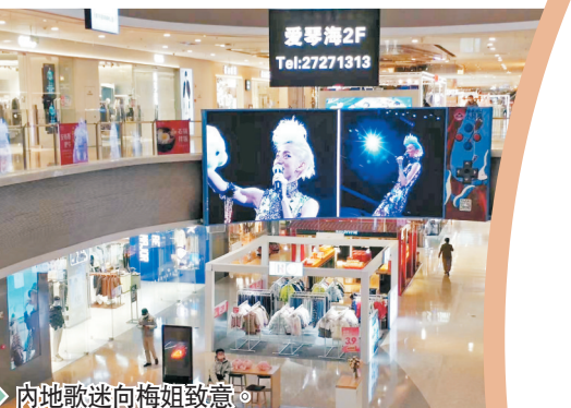
◆ 內地歌迷向梅姐致敬。