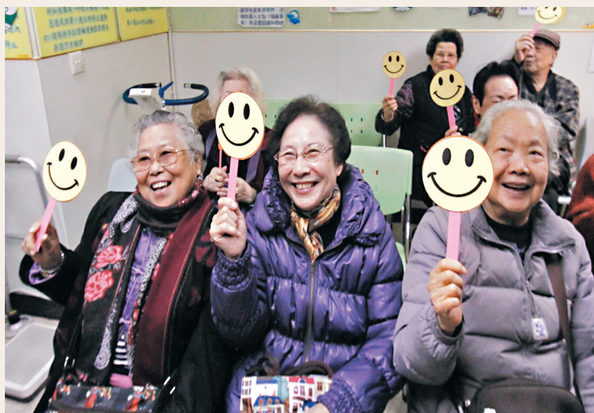
◆一項調查發現，港人的開心指數由去年的6.44分升至今年的6.59分，是2018年以來的最高水平。圖為長者展歡顏。 資料圖片

學者：經濟未復甦須審慎 香港文匯報訊（記者 聶曉輝）雖然港人的整體開心程度有所提高，但調查亦指出背後的憂慮，當中以「香港整體經濟狀況」尤其明顯，該項指數在經歷黑暴及新冠疫情後，由2018年的5.25分跌至去年的5.06分，今年更進一步跌至4.69分。另外，根據自我評估後得出，55%受訪者出現輕度至嚴重抑鬱症狀，比例較去年增加7.9個百分點。「香港開心D」顧問司徒永富建議港人重點培養關愛、尊重和自我控制，「多關愛自己和他人、堅守誠信及尊重別人，都間接對開心指數有正面影響。」 香港都會大學人文社會科學院院長鄭志良10日在接受香港文匯報訪問時則指，過去幾年香港經歷社會事件及新冠疫情，開心程度自然下跌，如今疫情平穩，加上特區政府放寬防疫措施令指數回升亦屬預期之內，「睇得出今屆政府的即時反應明顯較快，但目前漸進式地調整防疫政策與部分期望加快復常的商界和市民存在落差，因而令經濟狀況指數不升反跌。」