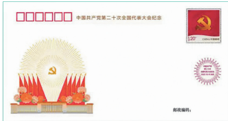
◆《中國共產黨第二十次全國代表大會》紀念封。