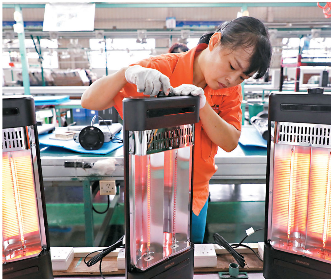
◆過去十年,中國市場主體總量達1.63億戶,相比2012年底的5,500萬戶,淨增超1億戶。圖為廣東順德一些家電企業預估到歐洲供暖市場的新需求,調整產品結構,靈活研發新產品適應市場的取暖需求。新華社

數據顯示,2020年以來,中國市場主體繼續保持增長,淨增3,700多萬戶,佔到過去十年淨增總量的35%,經濟展現更大韌性。