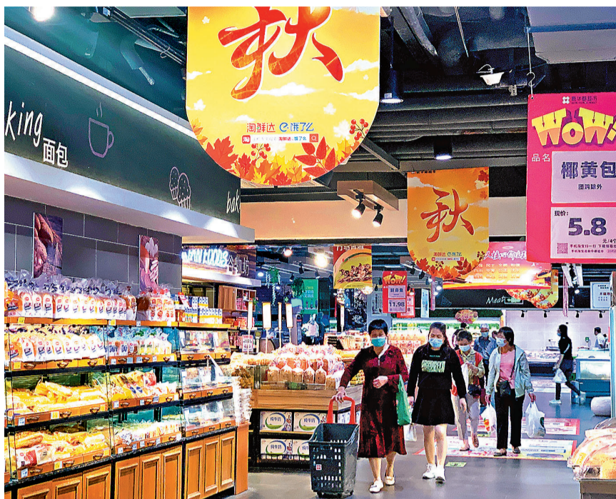
◆中國國家統計局數據顯示，居民收入增長與經濟增長基本同步。圖為10月11日，福建福州，市民在超市購物。