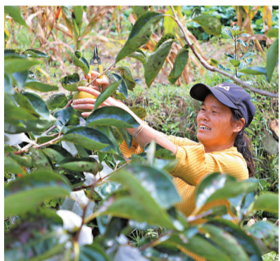
◆隨著鄉村振興戰略和脫貧攻堅各項政策縱深推進，中國農村居民人均可支配收入增速持續快於城鎮居民。圖為廣東省信宜市大成鎮北樓村村民忙着採摘成熟的甜柿。

區域發展總體戰略深入實施下，中西部地區居民收入增速明顯快於其他地區。2021年，東部、中部、西部和東北地區居民人均可支配收入分別為44,980元、29,650元、27,798元和30,518元，與2012年相比，分別累計增長110.1%、116.2%、123.5%和89.5%，年均增長8.6%、8.9%、9.3%和7.4%，西部地區居民收入年均增速最快，中部次之。