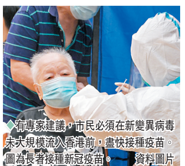
◆有專家建議，市民必須在新變異病毒未大規模流入香港前，盡快接種疫苗。圖為長者接種新冠疫苗。 資料圖片

庫上載的數目及資料很少，「目前主要在實驗室數據，它的免疫逃逸似乎加強了，現時只是見到實驗室中免疫逃逸的一些信號，不等於真實世界中它們有危險信號出現，現時需要觀察冬季是否有另一波大浪呢？」他指出，XBB.1是BA.2譜系衍生的變種，香港現時使用的兩款疫苗仍有效，公眾必須在新變異病毒未大規模流入香港前，爭取時間提升接種率，防止重症及死亡個案大幅上升，以及保護公營醫療系統。