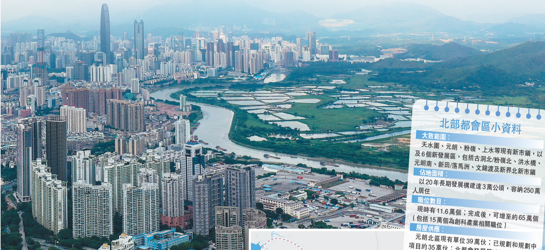
北部都會區是深圳河邊「深」藏着的發展潛力巨大的「新區」。