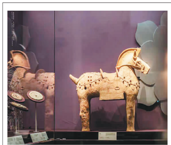
“跨越两国的审美：日本与中国汉唐时期文化交流”展览现场。

模仿中国铜镜式样、纹饰的日本仿制镜，日本奈良吉野出土的唐三彩兽足，记载日本遣唐使经历的并成真墓志拓片……在清华大学艺术博物馆近日举办的“跨越两国的审美：日本与中国汉唐时期文化交流”特展上，种类多样的文物勾勒出中日文明交流图景。