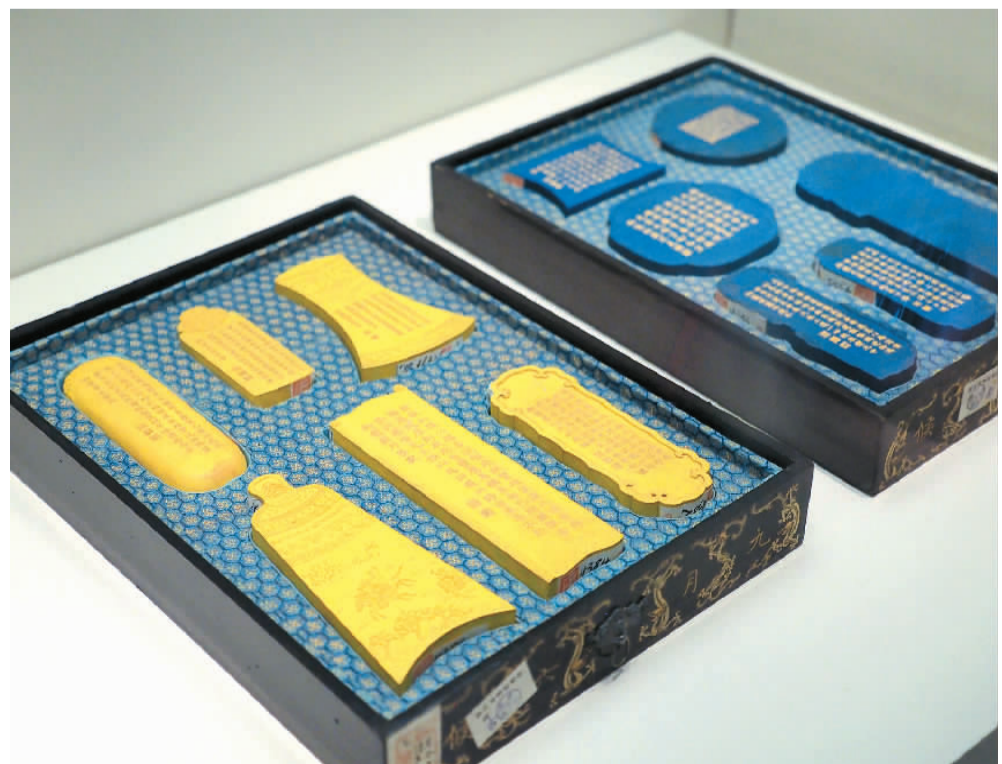
清乾隆“御制月令七十二候诗”彩色墨（九月、十月）。

在展览的结尾，一件霁青金彩海晏河清尊引人注目。此器外壁施霁青色釉，以金彩绘缠枝牡丹、蕉叶纹、如意云纹等，近足部饰彩釉仰莲纹及珍珠纹，肩颈之间雕贴一对白色展翅剪尾燕子作为耳。这件瓷尊是清代景德镇御窑为圆明园海晏堂烧制的陈设品，需多次入窑和施彩，工艺高超，集雕、贴、凸压之大成。此尊霁青色象征“河清”，燕与“晏”谐音，蕴含海晏河清、天下承平之意。