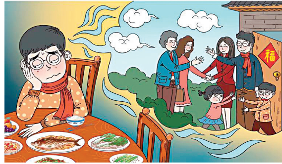
圖爲好久沒串親戚了。

2.這種事情很難開口。男科疾病，大家普遍認爲是隱疾。“談性色變”思想在我國根深蒂固，男性之間一般很少會談及自己的生殖健康問題。這與傳統的思想教育、內向的性格、受教育程度、社會閱歷等有關。他們中的大多數人會認爲，到醫院就診別人會用異樣的眼光看他們，就算因伴侶的強烈要求去醫院，也不能直接、真實、詳細向醫生表達病情，總是避重就輕。比如有些男性