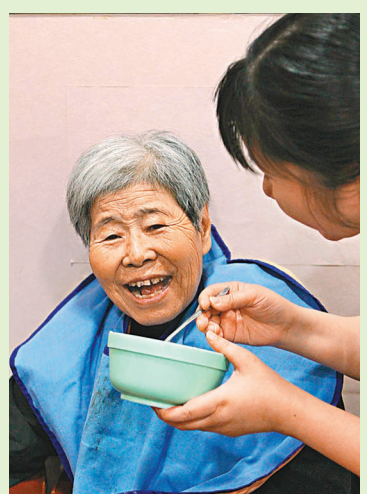
◆患有腦退化症需要人協助。

整體來說，筆者認為在第五階段前如能用中醫方法介入，治療效果是有的，亦可延緩患者退化到第六第七階段的時間。這個病對於患者及家屬都很难，希望在此能讓大家對中醫如何處理此病有多一點認識。