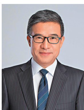
◆ 陳璋 香港文匯報深圳傳真