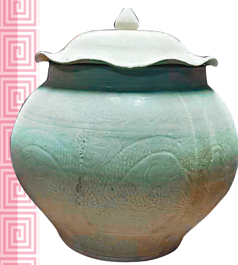
◆ 青白釉雲龍紋蓋罐