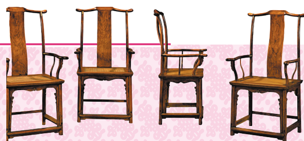
◆ 明十六世紀末至十七世紀初，黃花梨四出頭官帽椅一套四張

另外，藉香港回歸祖國25周年，香港中華文化藝術推廣基金主辦「回歸二十五周年《香港珍藏大展》」，近日於香港中央