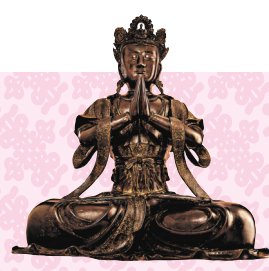
◆ 元末，明洪武，銅觀世音菩薩坐像

圖書館展覽館舉行，展出香港知名收藏家的國寶級瓷器及中式傢具藏品。展覽得到香港特區政府文化體育及旅遊局的支持，中國文聯港澳台辦公室、中聯辦宣傳文體部擔任支持單位，並得到香港賽馬會獨家贊助。