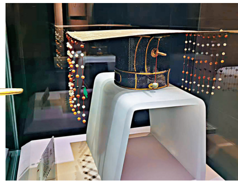
◆ 山東博物館十大鎮館之寶之一九流冕。