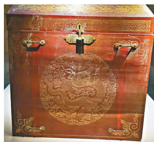
◆ 鎏金雲龍紋朱漆木箱