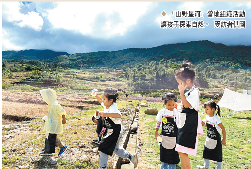
◆「山野星河」營地組織活動 讓孩子探索自然。

「山野星河」自然營地相關負責人介紹，打造這個營地的初衷，源於一個自然教育的理念——只有被自然感動過的小孩，才會更熱愛生活。但其實這不僅僅對於孩子，對成人來說也是一樣的。所以「山野星河」打造了一個集自然教育、親子遊樂、戶外拓展、露營、團建、攝影等於一體的戶外自然營地。「我們以營地為媒介，想傳達一種自然而美好的生活方式，以及人與自然萬物之間的聯繫。」