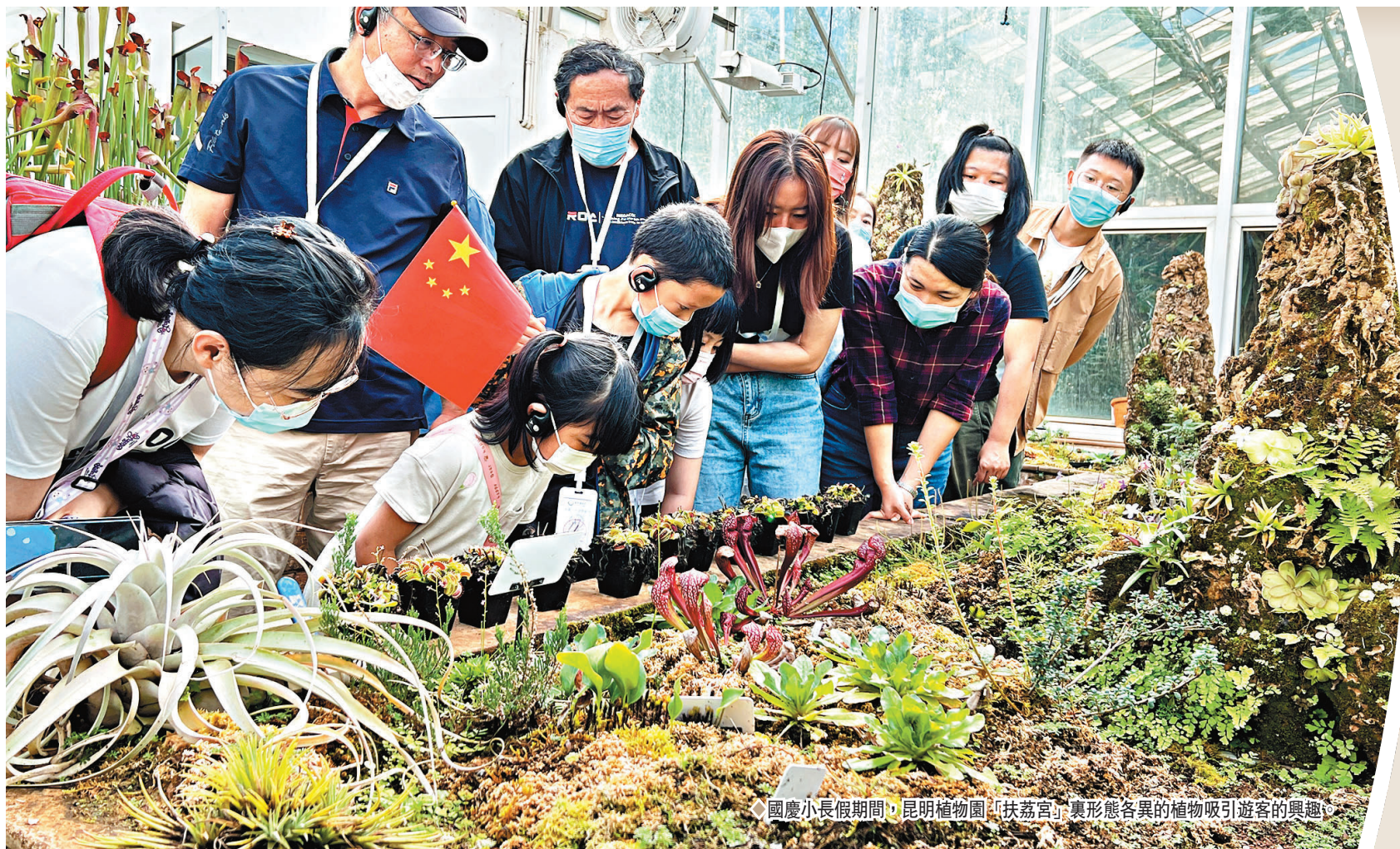
國慶小長假期間，昆明植物園「扶荔宮」裏形態各異的植物吸引遊客的興趣。