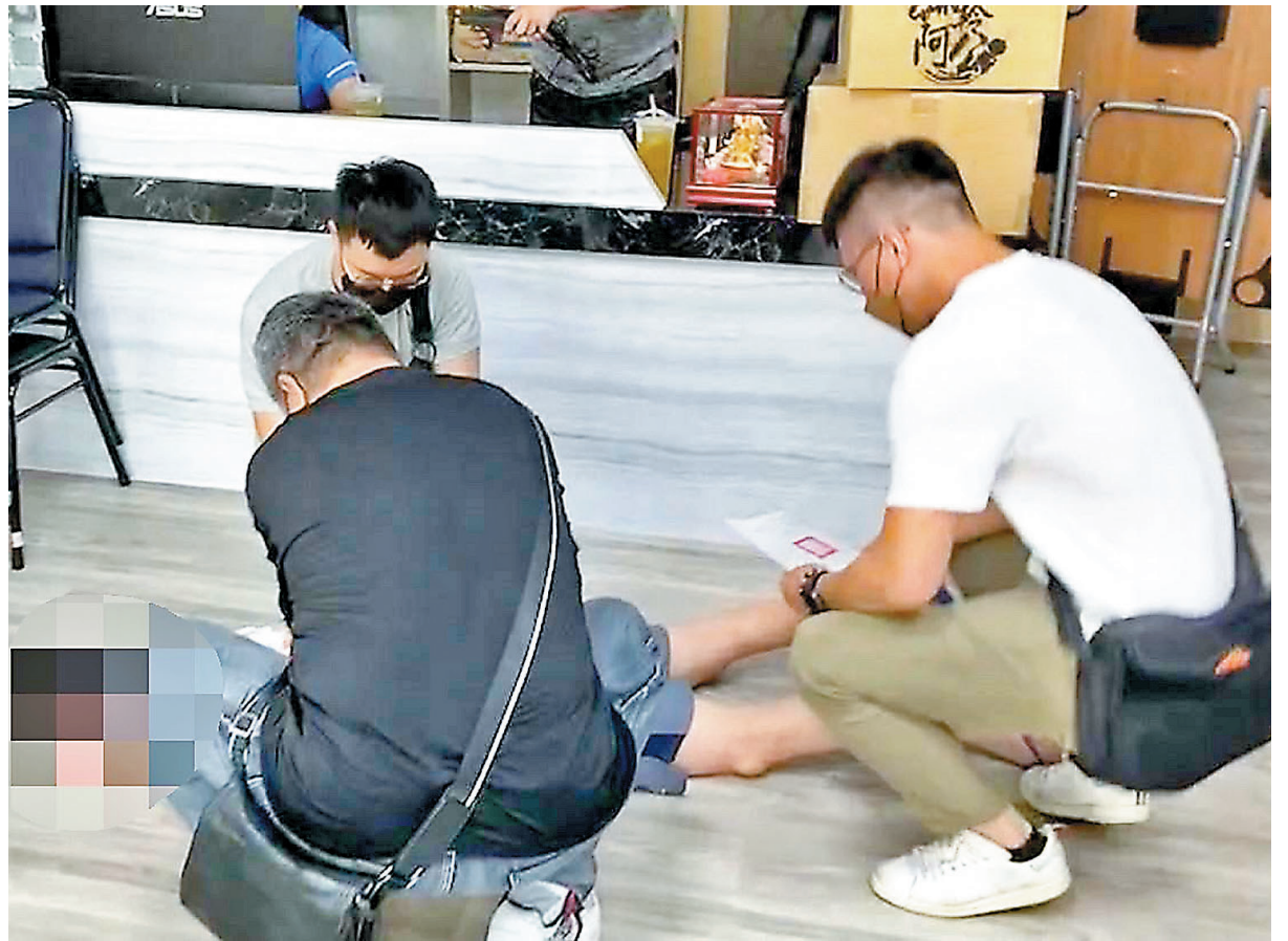
◆台內務事務主管部門負責人徐國勇3日在接受質詢時披露，有關部門偵破相關人口販運案100宗，並拘捕284人。圖為早前台南市警方發現，有人蛇集團以月薪新台幣10萬元到柬埔寨擔任打字員等條件，誘騙民眾出境從事詐騙工作，循線攻堅逮人。資料圖片

但蔡英文卻除了喊「超前部署」的空洞政治口號之外，主要精力都在製造兩岸對立，反而對導致台灣地區長期存在的缺電、缺水、缺土地、缺人才、缺資金等「五缺」問題不上心，致台灣經濟在世紀疫情的大背景下，貧富差距進一步擴大，大批年輕人面臨畢業即失業。無法找到工作的年輕人要麼在島內選擇做服務業、時薪制的低薪工作，要麼在「高薪」利誘下選擇賭一把，並將海外擇機當成最後一根稻草。