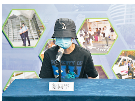
◆遇騙內地女生3日現身記者會公開呼籲大家提高警覺，以免受騙。