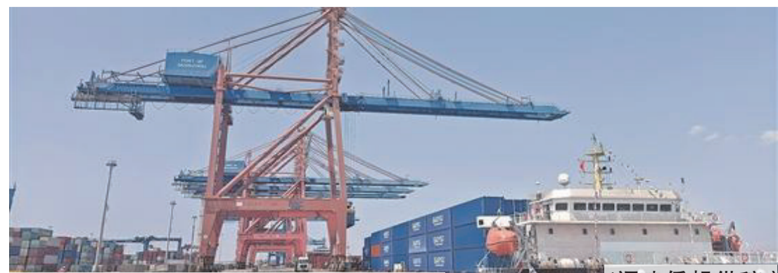
中國泉州—俄羅斯遠東航線開通，貨船裝滿集裝箱準備啟航。

目前，泉州石湖港已開通外貿航線12條，與廈門港初步形成遠近洋錯位發展格局。今年8月，港區完成集裝箱吞吐量12.9萬標箱，同比增長19.47%。其中，外貿集裝箱吞吐量完成9590標箱，同比大幅增長43.9%。