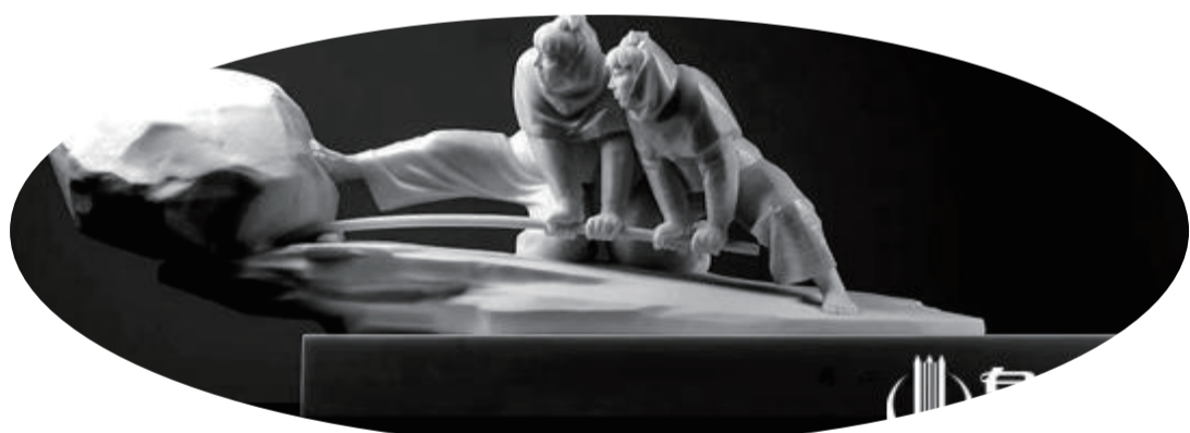
《同心協力》

泉州網訊(記者陳智勇)日前，第十五屆中國民間文藝山花獎頒獎典禮在浙江省杭州市舉行，惠安石雕《同心協力》榮獲優秀民間