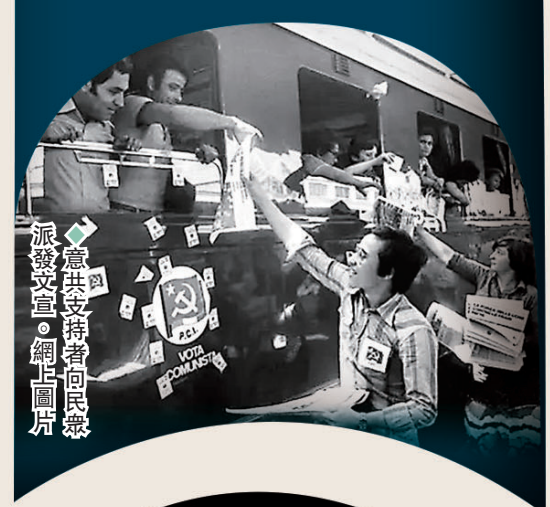
派發文宣。網上圖片

英國外交部在冷戰時期成立的秘密部門「信息調查部」(IRD)，近年被揭發是煽動大量輿論攻勢的幕後黑手。這些「黑色宣傳」不單攻擊蘇聯等敵對陣營，更將黑手伸向歐洲盟國。《觀察家報》2 日披露 1976 年意大利大選期間，IRD 便炮製大量虛假信息，專門針對當時呼聲甚高的在野意大利共產黨(意共)。這也成為 IRD 翌年遭傳媒曝光被迫關閉前，完成的最後一次「黑色宣傳」。