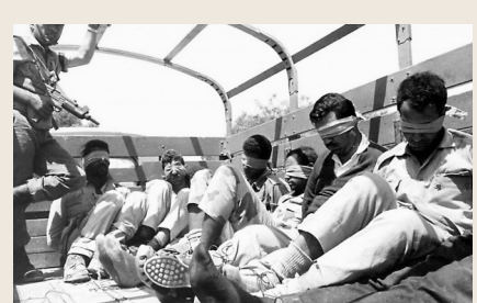
◆1967 年阿拉伯國家在六日戰爭中落敗後，英 IRD 偽造聲明宣傳蘇聯「對埃及浪費大量援助武器和物資感憤怒」。網上圖片

英國外交部秘密部門信息調查部 (IRD) 在冷戰期間，一直是英國政治宣傳戰的重要機構。在數十年間，IRD 不斷通過炮製虛假信息、偽造官方聲明、虛構激進組織等方式，試圖在敵對陣營中煽動輿論，達到挑撥離間效果。IRD 也會攻擊左翼組織或相關人士，以期「保護英國利益不受威脅」。