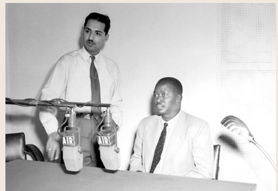
◆肯尼亞前副總統奧廷加(右)未能掌權後被逐出政壇。