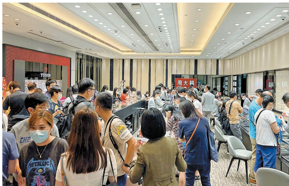
新一期消費券在國慶日發放後，商場金器銷情勁升。

費信心更見高漲，加上新一期電子消費券發放，商場丁財兩旺，生意額按年升20%至30%。其中，新鴻基地產(簡稱新地)十五大商場包括apm、大埔超級城、世貿中心、新太陽廣場、元朗廣場、柴灣新翠商場、上水新都廣場等，於國慶假期前夕連周末共三天商場人流及生意按年分別升逾20%。