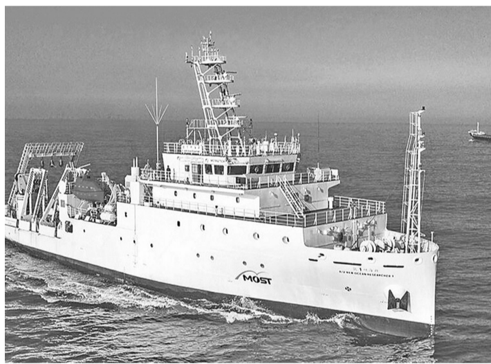
台湾大学“新海研1号”

【环球网综合报道】中时新闻网、ETtoday新闻云等台媒10月3日最新披露，台湾大学“新海研1号”研究船9月底在台湾东部海域进行科学研究，却被日本海上保安厅公务舰艇骚扰。台属经济海域”，未经同意不得进行科学研究。