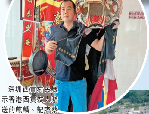
深圳西貢村民展示香港西貢友人贈送的麒麟。