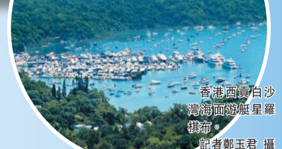
香港西貢白沙灣海面遊艇星羅棋布。