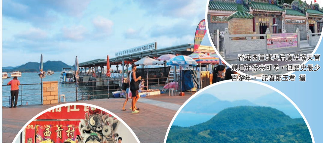
香港西貢天后廟及協安宮興建年份未可考，但歷史最少百多年。