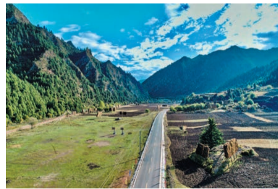
甘南「洛克之路」——國道248線扎古錄至江車至卓尼交界養護工程建成啓用。

【香港商報訊】記者寇剛報道：在甘肅省甘南州有一條被遊客稱之為「此生必駕」的洛克之路，亦被譽為「中國最美公路」。這條甘南草原深處的「洛克之路」以沿途風景優美而著稱，因著名美國植物學家約瑟夫·洛克當年考察行走而得名。6月，甘南州對該路段展開了養護提升。近日，國道248線扎古錄至江車至卓尼交界養護工程建成啓用。注重環保，建設綠色工程，打造「綠色天路」是該路段養護工程施工過程中遵循的準則。記者了解到，國道248線穿越國家自然保護區核心區和緩衝區，生態環境極為脆弱。建設單位和參建人員不斷加強生態環境保護，從污染防治、環境監測等角度規範環境保護管理。隨着該路段的「重啓」，在這裏，可以繼續感受古老秘境的純粹，與連綿的山巒、悠悠的白雲為伴，在雲霧蒸騰中觸摸這個如油畫般的地方。「一路通江送，天堑變通途」。拋開「自駕者」的「趨之若鶩」不談，更重要的是該路段承擔着卓尼縣向南聯繫迭部、四川，向北連通臨夏州和省會蘭州的主要幹線功能，對實現沿線漢族、藏族、回族自治州互通有無，實現民族融合發揮着積極作用。據介紹，該路段開通對周邊三縣五個鄉鎮近3萬各族群眾改善交通出行條件，着力打造全域旅遊交通網絡大環線具有重大意義。