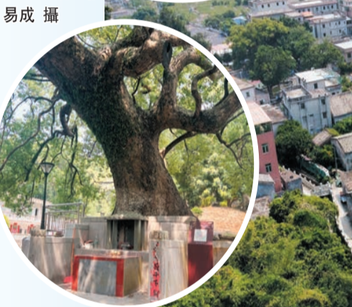
深圳西貢村民把這棵有着500多年樹齡的古樟樹視作神物。