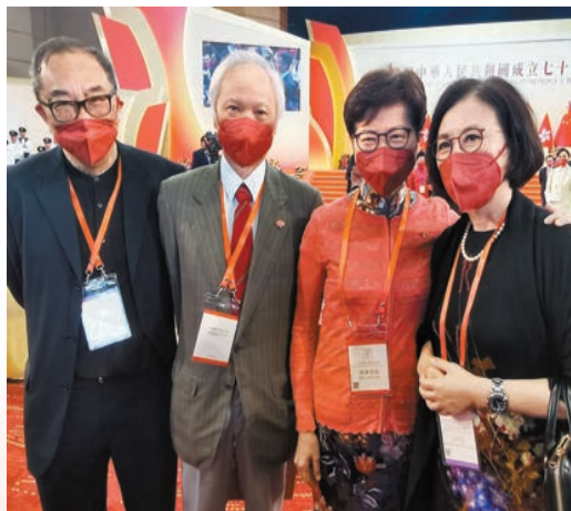
林太林生與汪明荃(右一)合照。