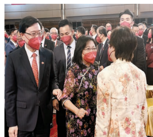
超嫂(右二)和曾蔭權太太太好傾。記者木子攝