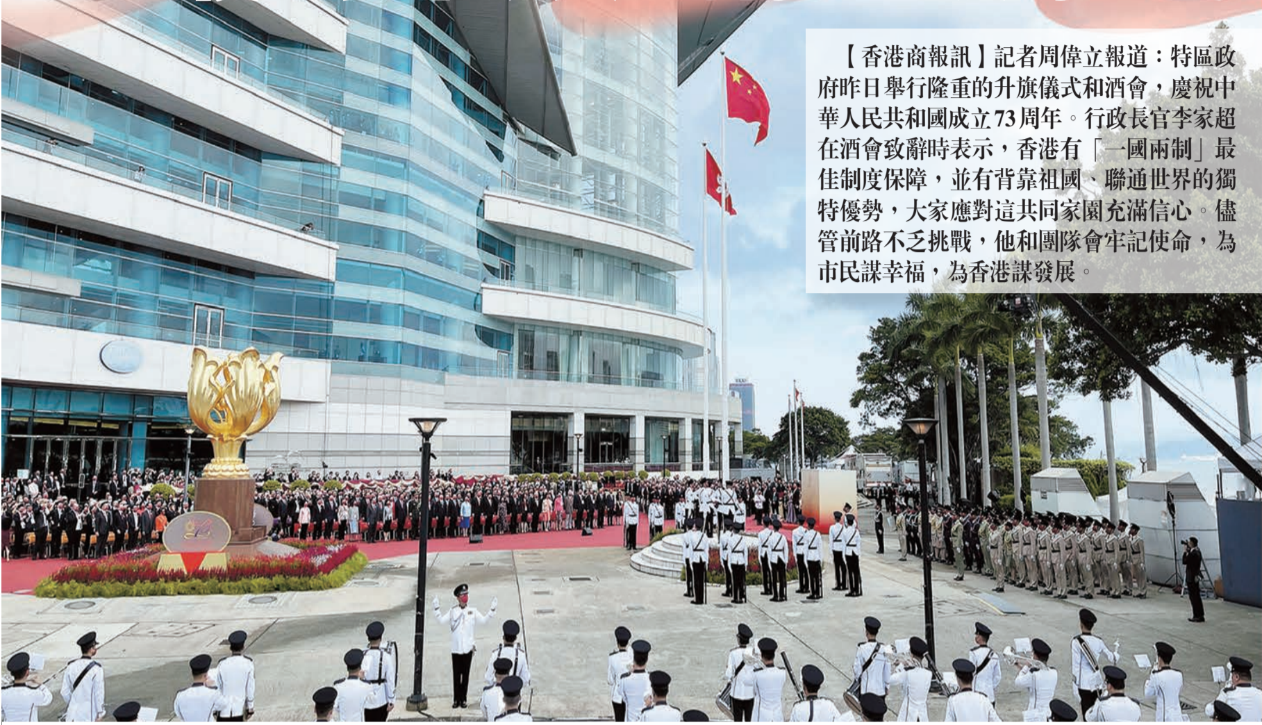
特區政府昨日上午舉行慶祝中華人民共和國成立73周年升旗儀式。新華社

升旗儀式上午8時在金紫荊廣場隆重舉行。全國政協副主席梁振英、香港特區行政長官李家超、中央駐港機構代表，以及香港特區終審法院首席法官、特區政府主要官員、立法會主席、行政會議成員等佩戴紅色口罩，出席活動。由於新冠疫情風險，儀式未有設立公眾觀禮區。