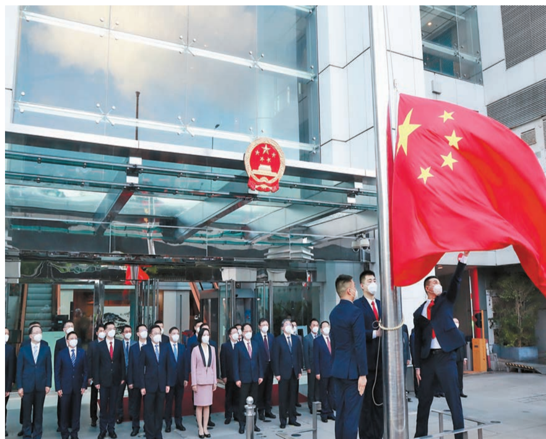
中聯辦昨舉行國慶升旗儀式。

【香港商報訊】記者周偉立報道：昨日是國慶日，中央人民政府駐香港特別行政區聯絡辦公室（香港中聯辦）、中央人民政府駐香港特別行政區維護國家安全公署（中央駐港國安公署）、中國外交部駐香港特別行政區特派員公署（外交部駐港公署）和中國人民解放軍駐香港部隊（解放軍駐港部隊），分別舉行升旗儀式，慶祝中華人民共和國成立73周年。