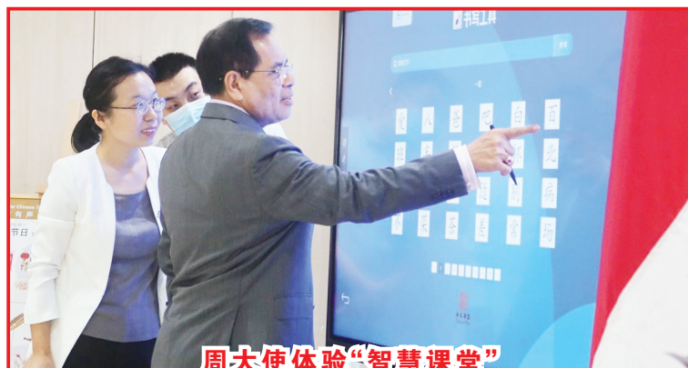
周大使体验“智慧课堂”