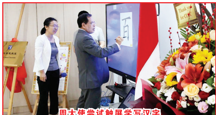
周大使尝试触屏学写汉字

尼讲师在职业领导力、创新学习技术上进行了培训，还提供了本科、硕士和博士中文教育奖学金的资助。同时，周浩黎表示大使馆也将继续鼓励在中国