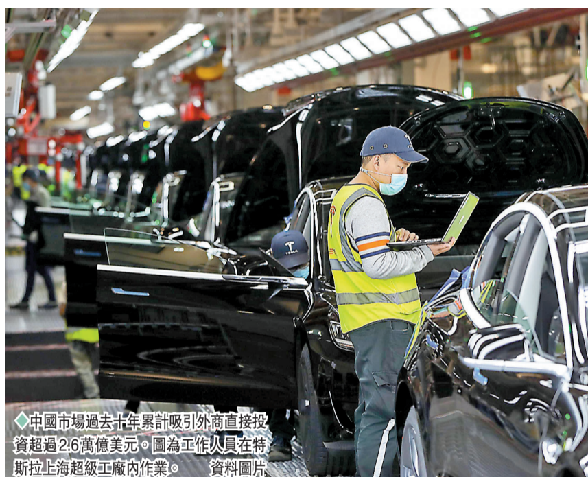
◆中國市場過去十年累計吸引外商直接投資超過2.6萬億美元。圖為工作人員在特斯拉上海超級工廠內作業。