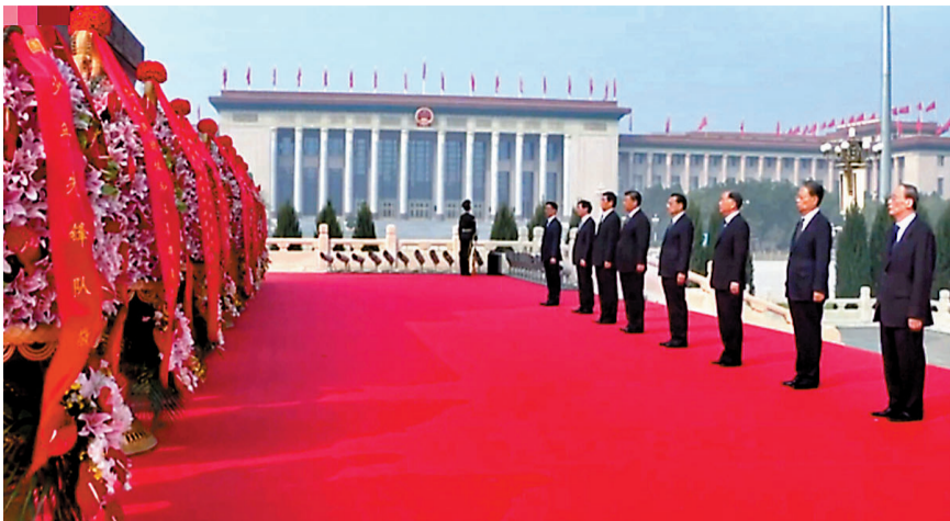
◆習近平等黨和國家領導人同各界代表一起，在天安門廣場向人民英雄敬獻花籃。

香港文匯報訊 據新華社報道，烈士紀念日向人民英雄敬獻花籃儀式9月30日在北京天安門廣場隆重舉行。黨和國家領導人習近平、李克強、栗戰書、汪洋、王滬寧、趙樂際、韓正、王岐山等，同各界代表一起出席儀式。