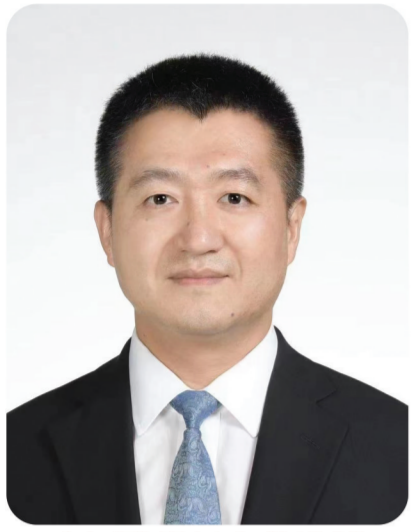
中国驻印尼大使陆慷

73年来，在中国共产党的坚强有力领导下，中国人民努力奋斗，取得举世瞩目的发展成就。