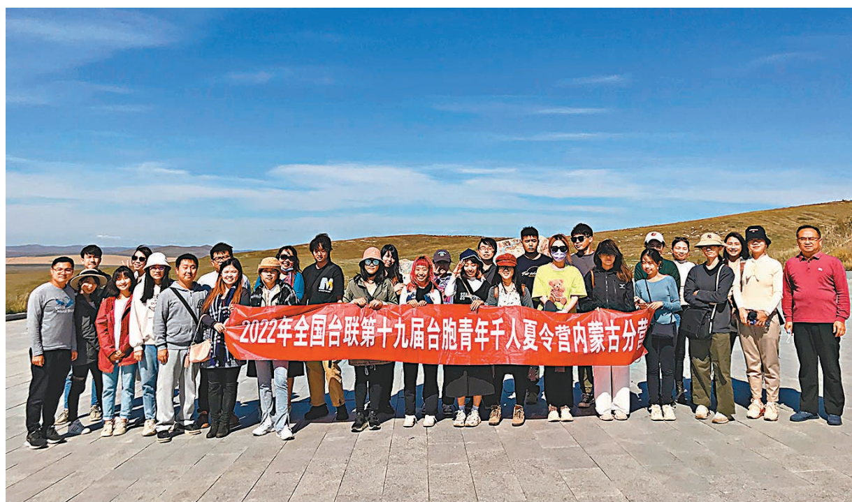
◆朱鳳蓮表示，解決台灣問題、實現祖國完全統一，是中國共產黨矢志不渝的歷史任務。圖為由全國台聯主辦的第十九屆台胞青年千人夏令營內蒙古（東線）分營9月4日在呼倫貝爾落下帷幕。28位台胞青年到訪額爾古納、新巴爾虎左旗等地，踏上邊疆名山，走近非遺技藝，觀賞馬術表演，深入體驗當地特色文化。

針對美國前國務卿蓬佩奧宣訪中國台灣地區、聲稱「台灣為獨立國家」，朱鳳蓮亦回應指出，蓬佩奧是什麼樣的人，大家都清楚：民進黨當局一再鼓動他宣台招搖撞騙，花了台灣百姓多少血汗錢？應該對台灣百姓有個交代。此外，針對民進黨當局日前聲稱，「很遺憾沒有收到第41屆國際民航大會的邀請」，朱鳳蓮則表示，國際民航組織是聯合國專門機構，只有主權國家才有資格參加。台灣作為中國的一部分，無權參加。朱鳳蓮強調，民進黨當局勾連外部勢力編織各種理由要求參與國際民航組織大會等活動，真實目的是謀「獨」搞分裂，必遭歷史挫敗。