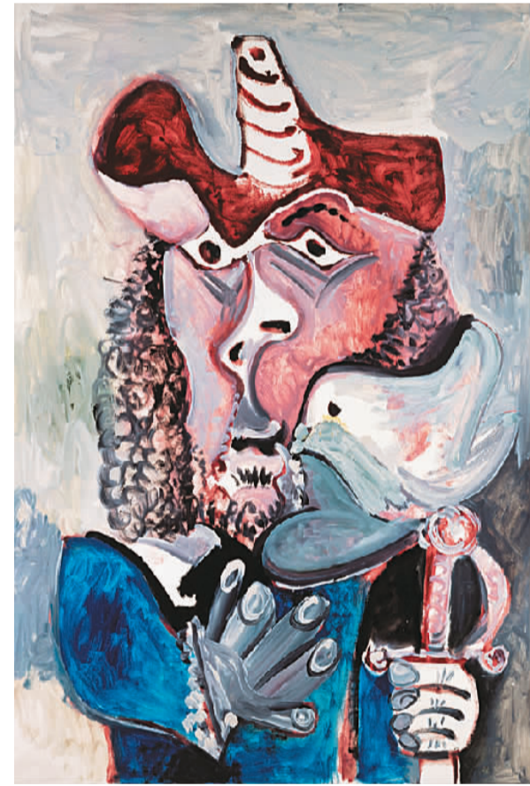
▲带鸟的步兵（油画） 巴勃罗·毕加索（西班牙）

2016年，中国美术馆首次举办以“永恒的温度”为主题的特展，以纪念捐赠者的大爱。作为捐赠的受益者，中国美术馆再次以“永恒的温度”为题，希望通过展览，让这些作品的情感温度和中德友谊的温度不断升温。