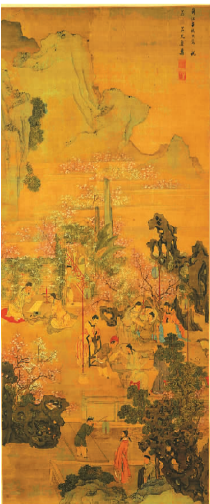
▲春夜宴桃李园图 吕焕成（清）

日前，以“人·境——古代文人的园中雅趣”为主题的古代绘画作品展在辽宁省博物馆展出。本次展览由辽宁省文化演艺集团（辽宁省公共文化服务中心）主办，辽宁省博物馆、北京画院承办，汇集了全国9家博物馆的71件（套）绘画珍品。这些绘画珍品均与中国古代园林密切相关，时间跨度宋、元、明、清，将古代文人的园林旨趣向观众娓娓道来。