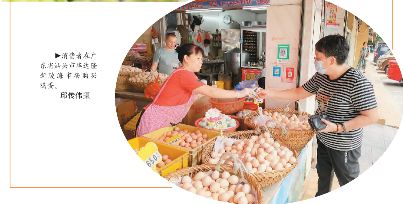
消费者在广东省汕头市华达隆新陵海市场购买鸡蛋。

9月19日，国家发展改革委新闻发言人孟玮介绍，今年以来，国内生猪价格经历了先跌后涨的过程，近期在每公斤22—24元区间波动；最近一周猪肉粮比价8.38:1，处于猪肉储备预案确定的6:1至9:1合理区间的上沿。