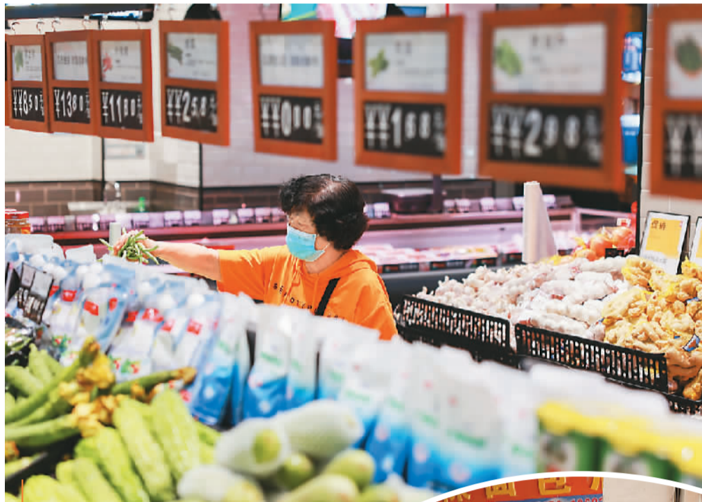
近日，居民在河北省邯郸市一家超市选购蔬菜。

根据国家统计局数据，对全国流通领域9大类50种重要生产资料市场价格的监测显示，9月中旬与9月上旬相比，30种产品价格上涨，17种下降，3种持平。其中，生猪(外三元)价格为23.7元/千克，环比上涨0.9%。此前数据显示，9月上旬，生猪(外三元)价格为23.5元/千克，环比上涨4.4%。