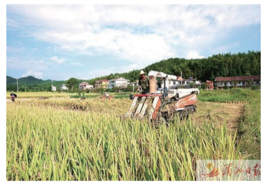
鐘山鎮卓泉村推廣機械化收割。

高標準築牢糧食安全根基，仙游縣行穩致遠，通過不斷壓實地方政府責任，不折不扣兌現糧食生產政策，加大對種糧大戶、家庭農場、合作社等支持力度，確保政策落地見效、秋糧顆粒歸倉，推動鞏固拓展脫貧攻堅成果同鄉村振興有效銜接。 (湄洲日報記者 黃凌燕 通訊員 鄭志忠)