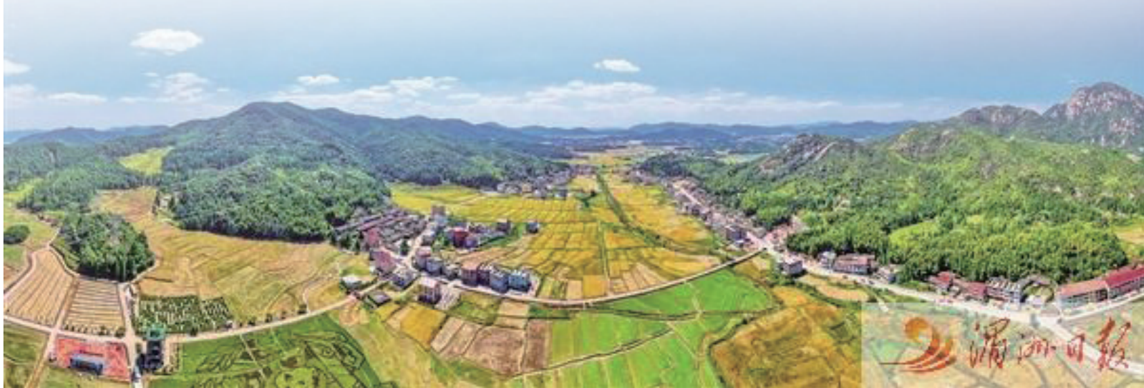
仙游縣高質量農田風吹稻浪香。