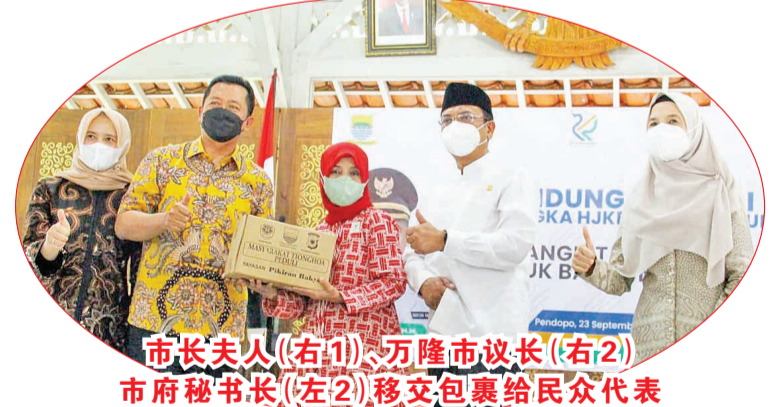
市长夫人(右1)、万隆市议长(右2) 市府秘书长(左2)移交包裹给民众代表