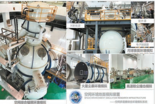
哈爾濱工業大學打造「地面空間站」——空間環境地面模擬裝置。

創新，是一座城市保持澎湃活力的重要基因。哈爾濱市科技局黨組書記、局長宋博岩表示，十年來，哈爾濱戰略科技力量穩步增強，科技創新成果不斷湧現，高新科技企業快速成長，創新創業活力競相迸發。