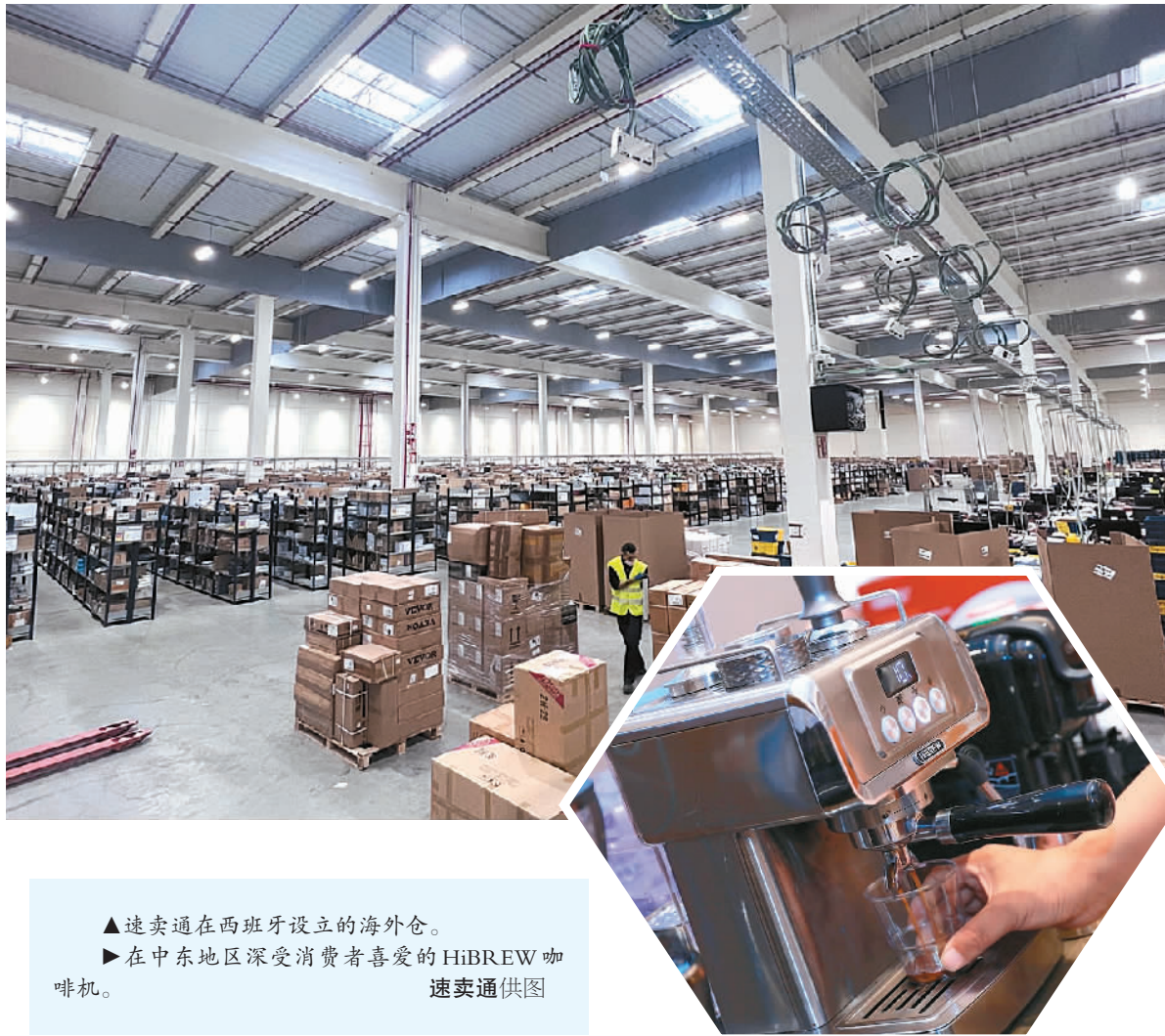
▲速卖通在西班牙设立的海外仓。 ▶在中东地区深受消费者喜爱的HiBREW咖啡机。

这种“单未下，货先行”的模式有助于缓解疫情影响。在深圳，部分跨境电商货物在防疫期间面临“出海”难题。为此，深圳海关出台了多项措施鼓励海外仓发展，包括将海外仓模式备案、审单业务统一集中在邮局海关办理、“一站式”归口办理海外仓模式备案等，缩短了业务办理时长，今年前7个月深圳关区新增海外仓备案企业数量同比增长2.5倍。