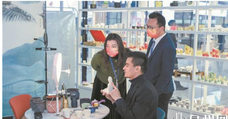
東南亞採購集散中心舉辦面向菲律賓客商跨境電商直播活動

2019年12月，泉州獲批國家跨境電商綜合試驗區，此後逐步形成綜合保稅功能區、口岸通關功能區、供銷一體化功能區以及市場採購功能區等四大功能區，持續推動跨境電商高速發展。泉州因此入選“中國跨境電商出口發展20強城市”，並獲批跨境電商零售進口試點城市。“一祇北太平洋的龍蝦，從打撈出海到餐桌，最快祇需要27個小時。”在泉州，老百姓對如此便捷的跨境購物體驗已經見多不怪。2019年12月，泉州獲批國家跨境電商綜合試驗區，此後逐步形成綜合保稅功能區、口岸通關功能區、供銷一體化功能區以及市場採購功能區等四大功能區，持續推動跨境電商高速發展。泉州因此入選“中國跨境電商出口發展20強城市”，並獲批跨境電商零售進口試點城市。