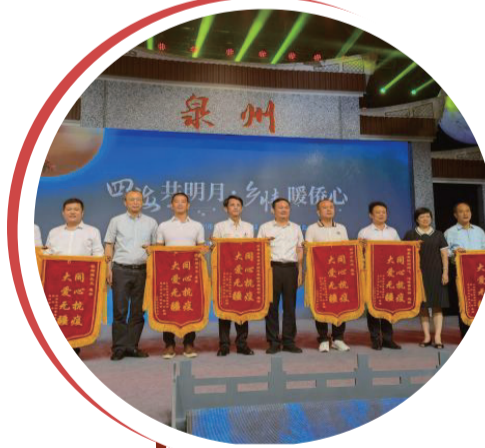
為部分到場的海外捐贈代表頒發“同心抗疫”錦旗。