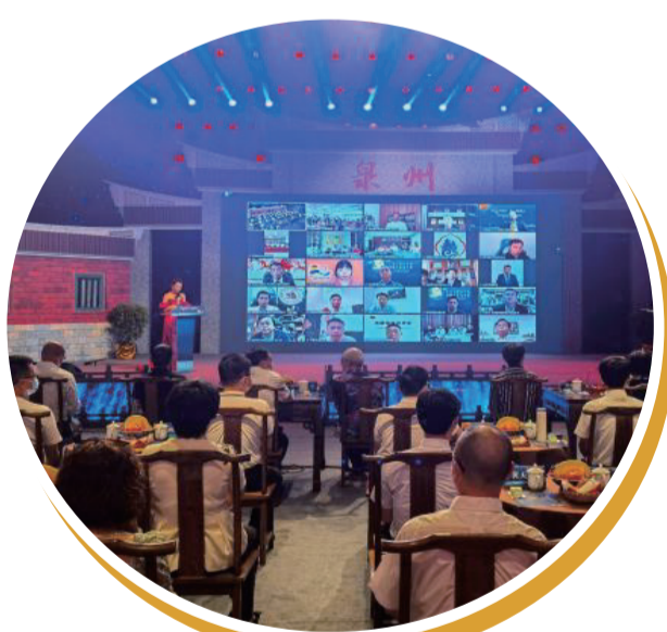
9月9日，福建泉州舉辦泉籍海外及港澳鄉親迎中秋聯誼活動。