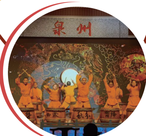
泉州少林寺武僧團表演《二十四節令鼓》。