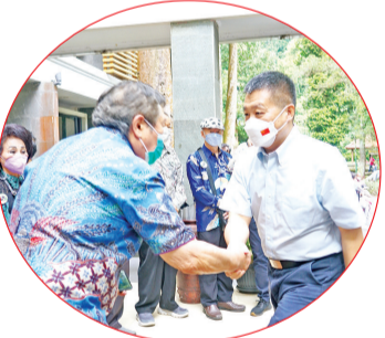
蔡亚声迎接陆慷大使