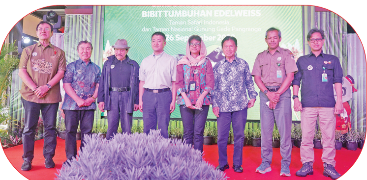
Indra 署长移交雪绒花植物后合影