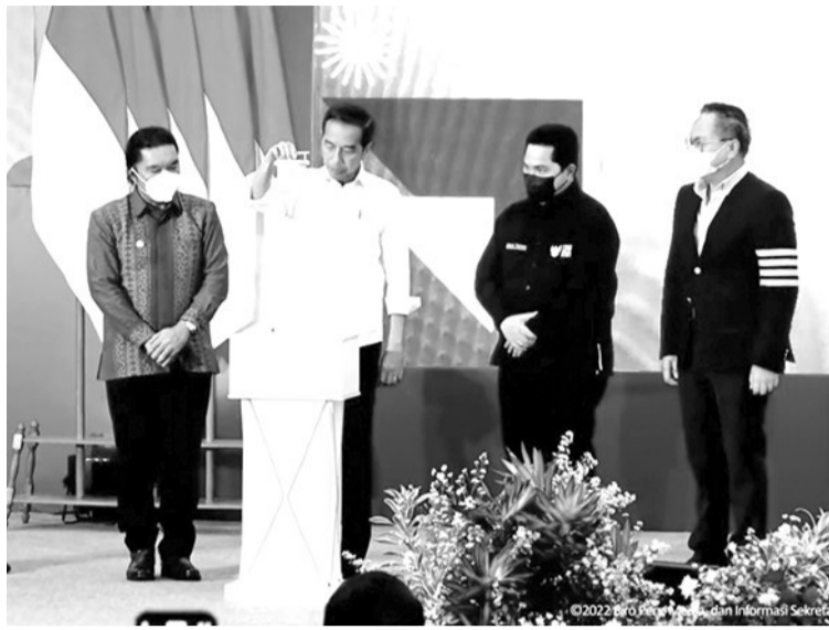
总统指示以科技抓住商机 佐科维总统在主持2022年国新企业日开幕式上声称，中小微企业必须以科技抓住商机。

发展空间。” 佐科维总统认为，我国目前仍有很多机会来改善新企业的发展，这可以从印尼的数字经济中看到，该经济已增长了很多倍。从类别来看，金融科技占23%为最大，其次是零售占14%，未来的粮食危机问题将是通过科技去解决的。 除此之外，初创企业或新兴企业也需要得到可持续生态系统的全力支持，这样才能成功进入市场并抓住现有的商机，因为约有80%至90%的创业企业在创业初期经常遭遇失败，这是因为他们没有了解市场的需求。(Sm)