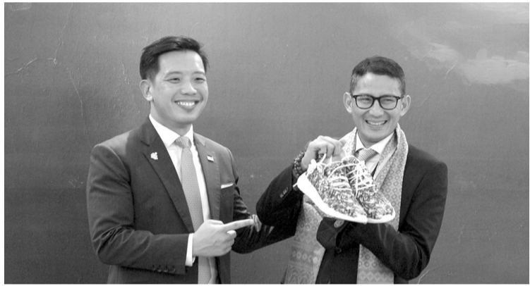
巴厘 G20 旅游部长会议 旅游与创意经济部长善迪亚卡(Sandiaga Uno/右)同新加坡贸工部兼文化、社区及青年部部长陈圣辉(Alvin Tan/左)，在巴厘巴通县努沙杜瓦举行二十国集团(G20)旅游部长会议后合影留念。

360万人次。” 直到目前为止，前来我国观光的外国游客人数仍然保持稳定，每日会达到1万人次至1.5万人次，外国游客的入住时间和购物开支也已有所提高。 根据记录，外国游客的入住或停留时间，从之前不到3天，如今已增为3天至4天，购物开支也从之前只有1000美元，如今已增为1200美元或增加了20%。 善迪亚卡说，我国也成功提高了世界级旅游竞争力。根据世界经济论坛发布的旅游与发展指数报告，我国位居世界第32位或排名上升了12位，成功超越了马来西亚、泰国和越南等东盟国家。(Sm)