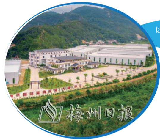
以省級蜜柚現代農業產業園為依托，大埔蜜柚走上規模化、科技化發展之路。