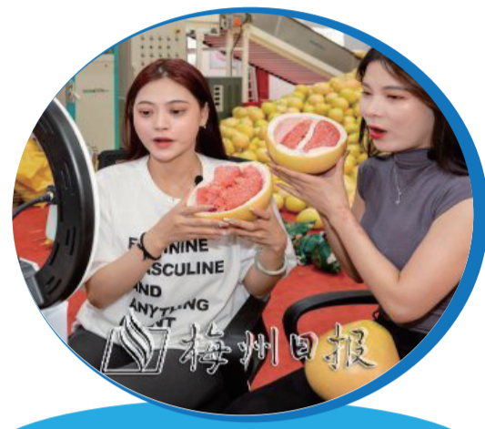
主播在梅州萬川千紅農業發展有限公司的蜜柚基地直播帶貨。

又是一年蜜柚飄香時。在大埔聚德生態發展有限公司蜜柚種植基地，柚農們正忙着將採摘好的蜜柚運至加工廠房，經過包裝後，發往全國各地。