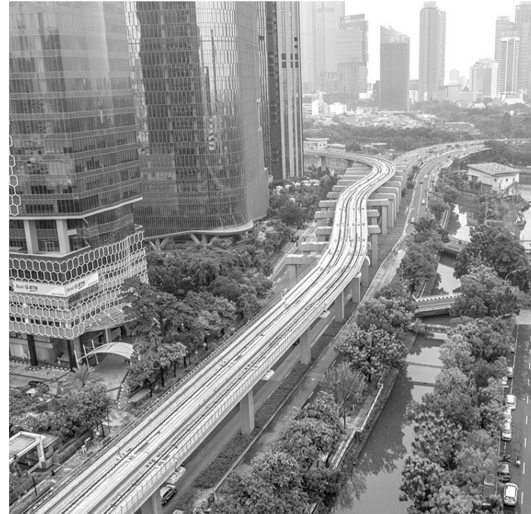
雅京和周边区轻铁明年中旬投运 雅加达和周边区的轻铁项目施工进度已达96%,预定2023年年中旬建成并开始投运。