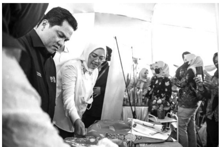
国企部长视察中小微业平价市场 国企部长埃里克·托希尔(Erick Thohir)在普哇加达县体育馆,视察中小微业平价市场和展销会。

根据国家研究与创新和海事与投资统筹部对海洋经济进行研究的成果,在2020年期间,我国领海的总生产总值达到1212万亿盾,或占全国生产总值(GDP)为10722万亿盾的11.31%,比2019年约达1231万亿盾有所下降,这或许是受到新冠肺炎病毒大流行负面影响的缘故,但海洋经济对国内生产总值的贡献有所增加,从2019年仅仅达到11.25%,2020年却增为11.3%。(Sm)