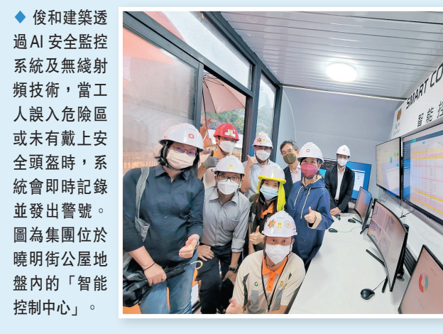
◆ 後和建築透過 AI 安全監察系統及無線射頻技術，當工人誤入危險區或未有戴上安全頭盔時，系統會即時記錄並發出警報。圖為集團位於曉明街公屋地盤內的「智能控制中心」。

工會希望發展商/政府推出工程時有合理施工期，當有些日子因疫情、惡劣天氣情況而被迫停工，就需要順延完成工程項目日期。特區政府身為全港最大「發展商」，更需要以身作則，定時檢討施工期是否足夠，在惡劣天氣下，基於工人安全角度考慮，暫停戶外工作。工會認為，萬一發生嚴重工業意外，勞工處介入調查意外原因，竣工期亦會延誤，因此應讓工人有足夠時間做好安全措施。