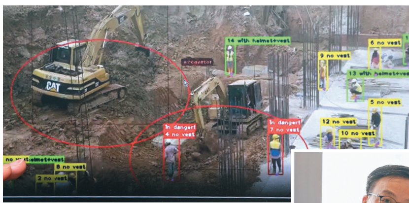
▲ 使用人工智能工地安全監察系統時，當有工人誤進「致命區」，就會觸發警報系統或者警報燈，系統亦會在工人頭上顯示紅色標誌。

後和建築主席李家齊指出，待相關技術成熟後，會把系統推廣至其他地盤。他說，集團一直致力推動建造業轉型，將創新科技如 AI、數據分析及傳感器等融入建造工序，藉以提高工程質量、效率以及安全性。冀望業界攜手同心，為市民能夠安居出一分力，透過創新技術，助政府加快建屋步伐，建設更美好的社區。