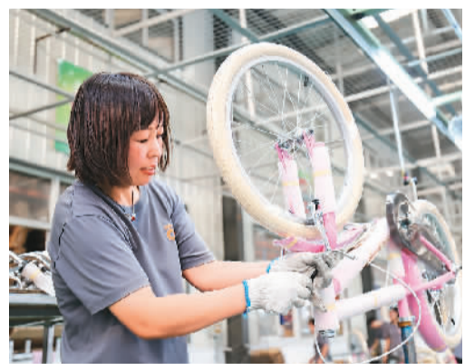
中国自行车工业发展迅速，产品热销国内外市场。图为日前，河北省邢台市平乡县一家童车企业员工在赶制出口订单产品。

工信部有关负责人表示，中国消费品工业增加值、行业利润、出口交货值占全部工业1/4左右，企业数、从业人数占全部工业近四成，在满足居民消费升级需求和日益增长的美好生活需要方面作出重要贡献。下一步，工信部将加快实施增品种、提品质、创品牌“三品”战略，不断提升消费品产品和服务供给能力，持续增强消费对经济增长的拉动作用，夯实扩大内需战略供给基础，推动实现中国工业经济平稳增长。