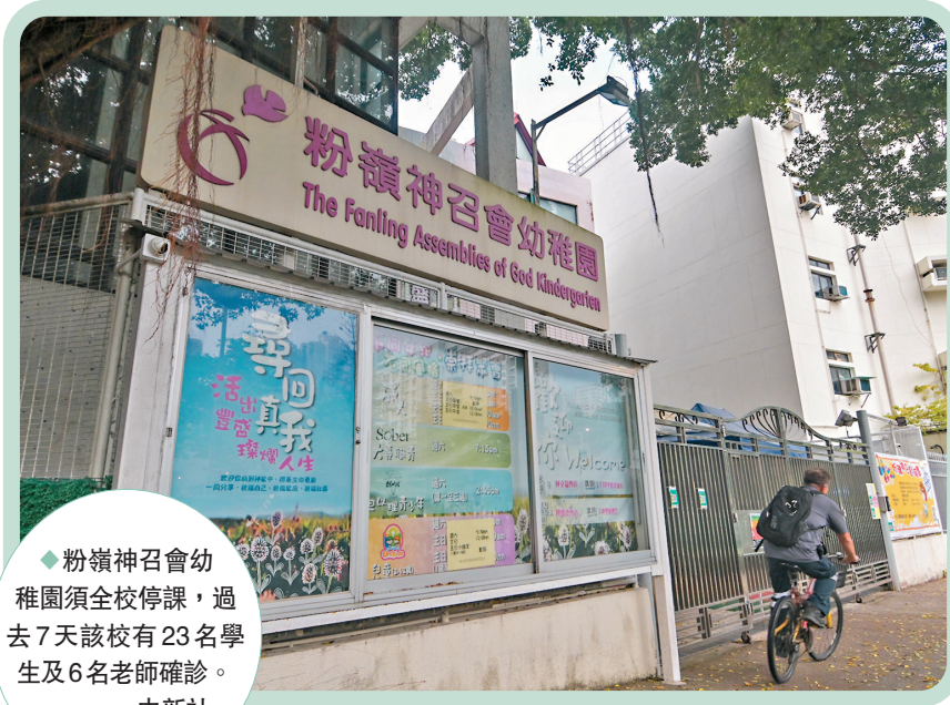
◆粉嶺神召會幼稚園須全校停課，過去7天該校有23名學生及6名老師確診。

另外，北區粉嶺神召會幼稚園近期陸續有23名學生和6名老師確診，涉及多個班別，學生們並無在校用餐。香港衛生防護中心研判後，為安全起見，建議全校暫時停課。