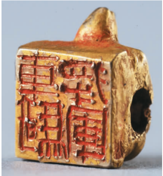
西汉“车骑将军”金印。

秦代兵马俑注重写实，俑的五官、身体比例与真人极为接近，汉代兵马俑则更注重写意，着力刻画人物神态。“这件武士俑头虽然只有头部，但由于保存完整、刻画细致、形神兼备而被定为国家一级文物。”马昆介绍。此俑头脸型方正，颧骨高凸，鼻梁高耸，眉眼口唇上扬，看上去像是