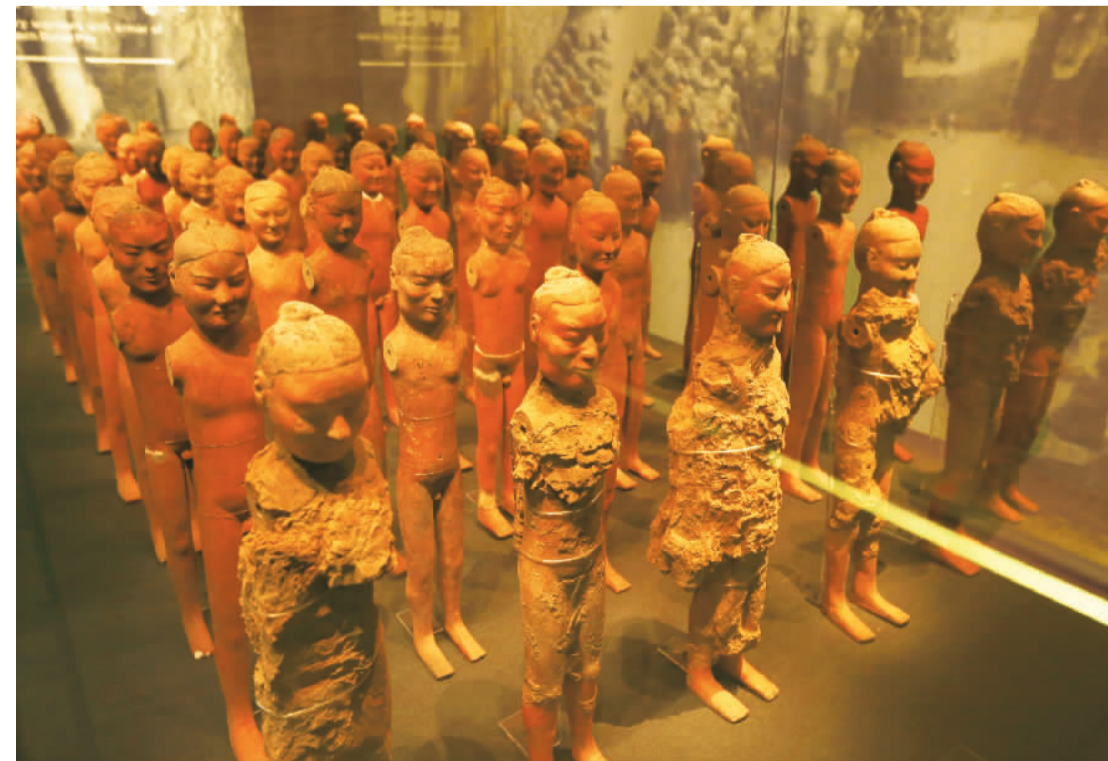
汉阳陵南区外藏坑出土武士俑。