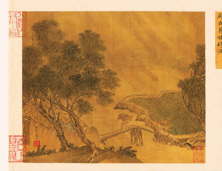
明周臣《夏畦时泽图》页。

元人《龙舟夺标图》展现了北宋宫廷在金明池举行龙舟夺标的场景，是宋元时期水嬉活动的缩影。金明池故址在今河南开封，是北宋的皇家池苑，皇帝常在此教演水军，举行龙舟夺标、宴饮等活动。每年农历三月初一至四月初八，开放金明池与琼林苑，允许游人自由出入。《龙舟夺标图》摹画精细，纯用白描，绘出巍峨瑰丽的宫殿院圃，池中有小龙船、飞鱼船、鲛鱼船等，蔚为大观。图中人物虽小，但为数众多，形态动作多样，或竞渡、或水嬉耍耍、或演奏、或侍立，细节丰富。