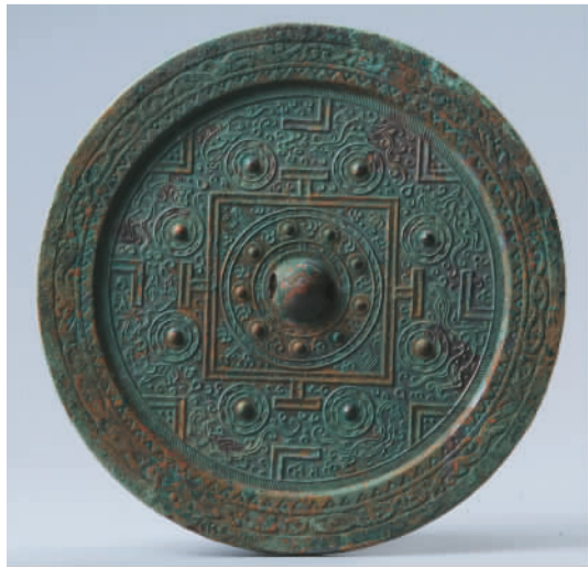
西汉“长宜子孙”规矩纹镜。