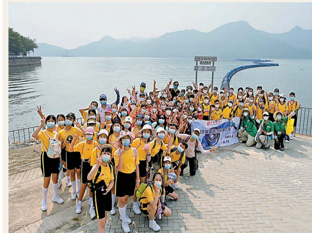
一眾團友在沙頭角之角「打卡」留念。

【香港商報訊】記者戴合聲報道：據特區政府新聞網報道，在港深邊境遙遠的一角，有一個香港人既熟悉又陌生的地方——沙頭角。這個禁區封閉已久，非常地居民難以進入，惟早前特區政府以試驗形式向本地遊旅行團開放禁區內的碼頭，市民終於有機會在週末或公眾假期踏足沙頭角，一窺當地歷史文化，飽覽海岸美景。