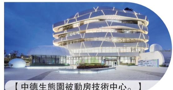
【中德生態園被動房技術中心。】