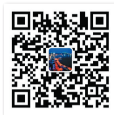
青島發佈 官方微信二維碼