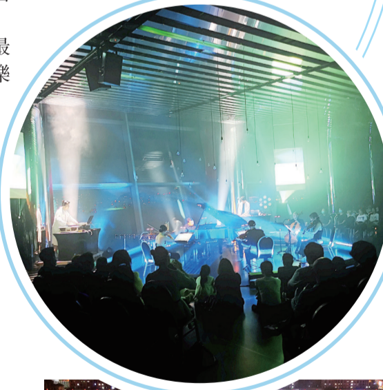
【譚盾音樂周開幕式音樂會現場。王雷攝】