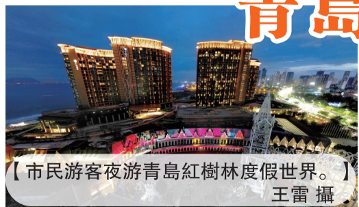
【市民游客夜游青島紅樹林度假世界。】

今夏旅游旺季，伴隨着海洋光影狂歡節的啓動，青島紅樹林度假世界燈光與星光交相輝映，音樂與海風纏綿相伴，多維炫酷的空間和超越視覺的光影景觀，6000多平方米的紅樹林小鎮廣場化身光影王國，整個度假區流光溢彩。除節目期間呈現的樓體秀、無人機表演，平日的青島