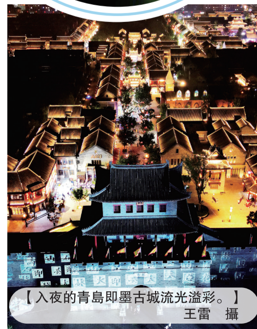
【入夜的青島即墨古城流光溢彩。】

青島夜之旅“重鎮”——青島西海岸新區為重點商圈及購物場所周邊配套公交路綫100餘條，延長隧道公交、地鐵運營時間以及博物館、美術館開放時間。打造了金沙灘啤酒城火鳳凰酒吧街、武夷山路酒吧街等4條酒吧街，連續舉辦多屆夜間國際馬拉鬆，發展了漁夫香園等48處特色民宿以及藏馬山房車營地、琅琊臺星空宿營地，逐漸形成了“夜游、夜購、夜娛、夜動、夜宴、夜宿”六大夜間旅游特色，夜游空間維度鮮明。（馬曉婷）