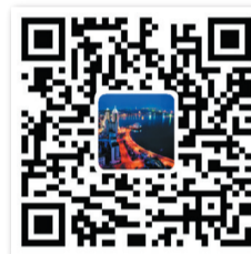
青島發佈 官方微博二維碼