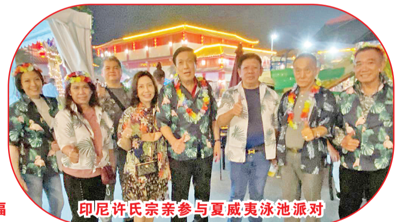
印尼许氏宗亲参与夏威夷泳池派对