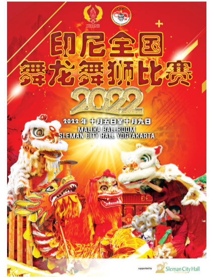
龙狮比赛海报宣传图