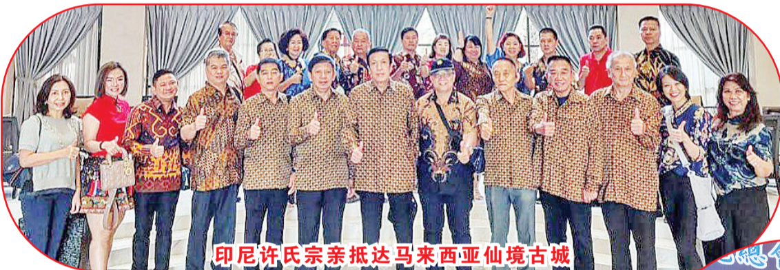
印尼许氏宗亲抵达马来西亚仙境古城