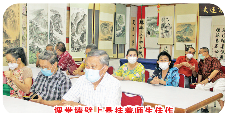
课堂墙壁上悬挂着师生佳作