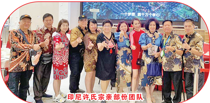
印尼许氏宗亲部份团队

和总会会所, 这种创新计划的大突破应该获得发扬并推动到印尼。仙境古城计划打造现代化墓园, 设有各项运动、健身和娱乐设施。以借此吸引更多的年轻人加入华社血绿组织, 都是来自一个先祖, 拥有同一个姓氏, 并共享同一份家族荣耀。