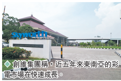
◆創維集團稱，近五年來東南亞的彩電市場在快速成長。

國市場容量的近一半，如果把東南亞市場做好，就等於做好了半個中國市場，而且東南亞不僅離中國較近，消費習慣也接近於中國，是創維走向海外的一個出海口。對於東南亞市場未來的規劃，創維將採取四大方向，包括以印尼為據點輻射整個東南亞市場，統一供應鏈；在經營策略上，產品從中低端向中高端轉型；嘗試「東芝」和「創維」雙品牌運作；嘗試線上運營以擴大市場份額。