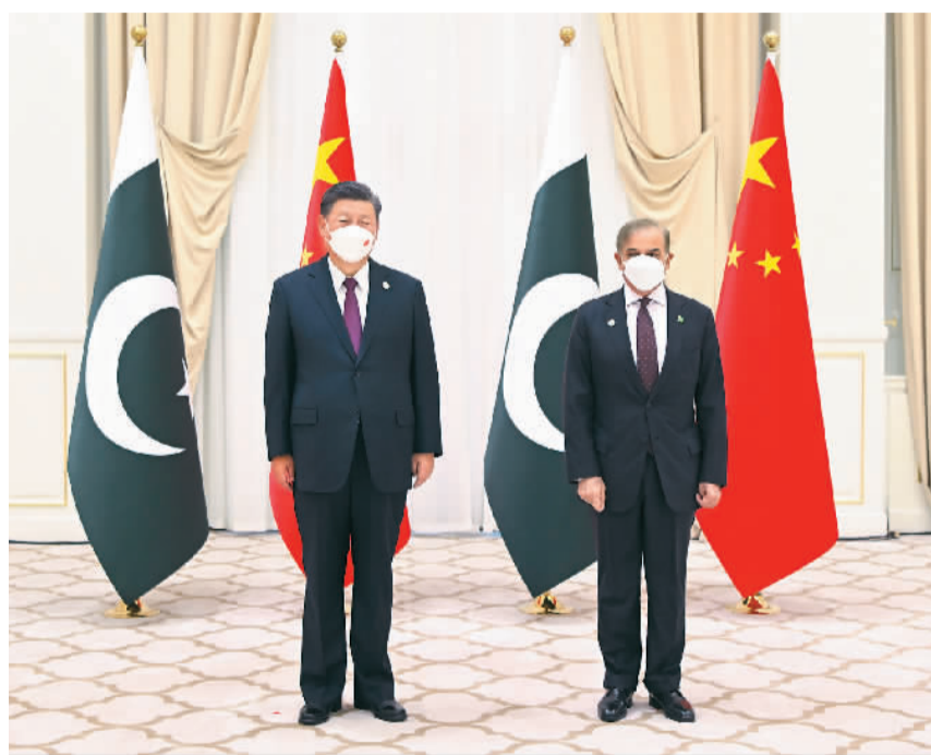
当地时间九月十六日上午，国家主席习近平在撒马尔罕国宾馆会见巴基斯坦总理夏巴兹。

夏巴兹感谢中方为巴基斯坦遭受严重洪涝灾害及时提供宝贵帮助。他说，习近平主席是富有战略远见的领袖，在习近平主席坚强领导下，中国取得伟大发展成就，为地区和世界和平发展作出重要贡献。巴基斯坦人民对习近平主席充满崇高敬意，把中国作为巴基斯坦永远的伟大朋友。预祝即将召开的中共二十大取得圆满成功！巴方坚定奉行一个中国政策，坚定支持中方在涉台、涉疆、涉港等核心利益问题上的立场，坚决反对一些势力损害中国主权、干涉中国内政的行径。巴中友谊牢不可破，无可比拟。巴方将全力保护好巴中公民和机构安全，致力于继续积极共建“一带一路”，把中巴经济走廊打造成互利共赢合作典范，愿同中方一道，推动巴中关系发展到新的高度。