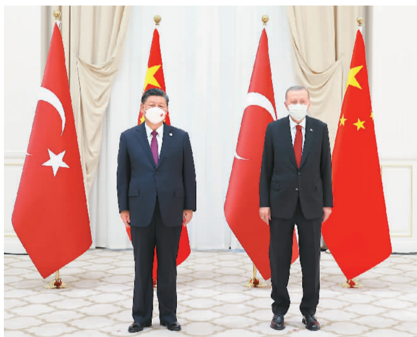
当地时间九月十六日上午，国家主席习近平在撒马尔罕国宾馆会见土耳其总统埃尔多安。

习近平指出，近年来，中土关系保持发展势头，两国务实合作稳步推进，抗击新冠肺炎疫情合作卓有成效。事实证明，发展好中土关系符合两国长远利益，对深