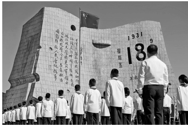
今年是九一八事变爆发91周年。9月18日上午,勿忘九一八撞钟鸣警仪式在沈阳“九一八”历史博物馆残历碑广场举行。

1931年9月18日夜10时许,日军自爆南满铁路柳条湖段,反诬中国军队所为,遂炮轰沈阳北大营,