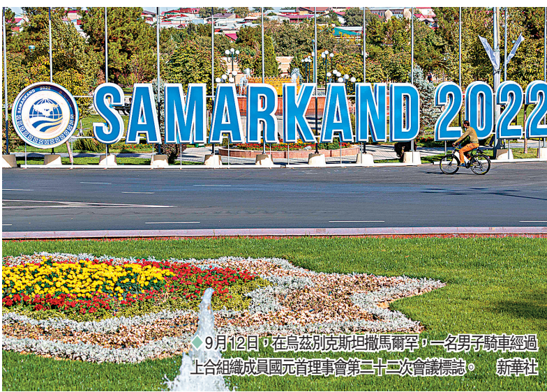
9月12日，在烏茲別克斯坦撒馬爾罕，一名男子騎車經過上合組織成員國元首理事會第二十二次會議標誌。