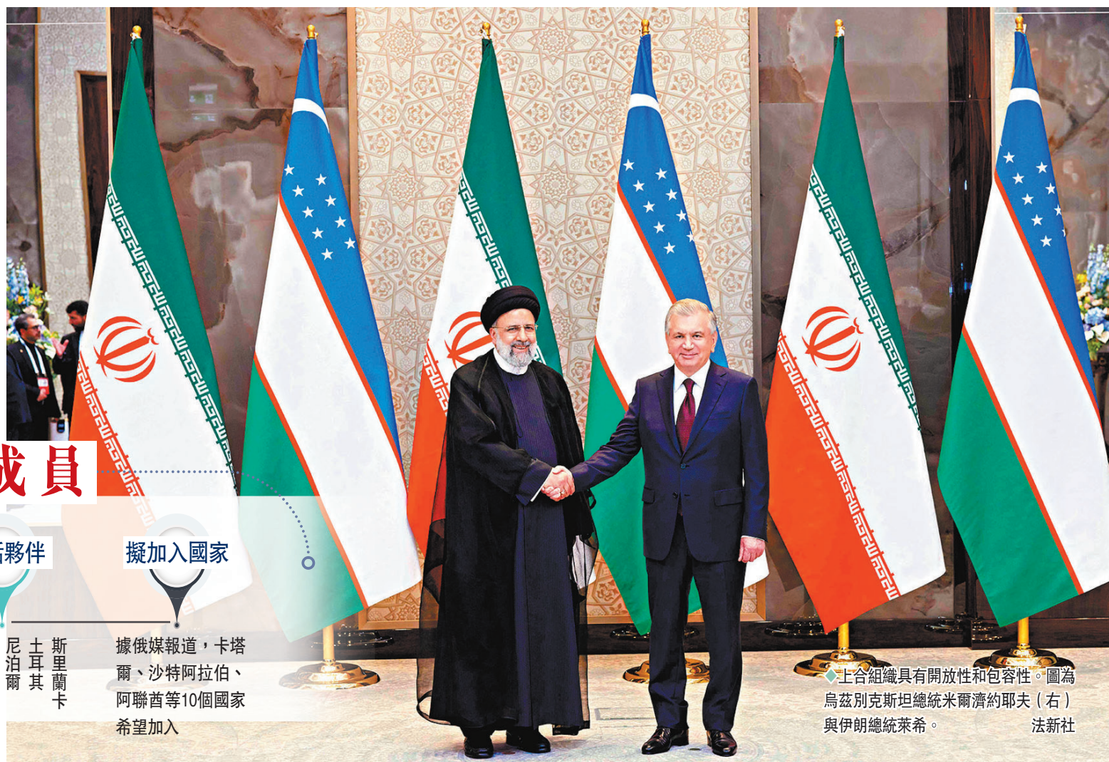
◆上合組織具有開放性和包容性。圖為烏茲別克斯坦總統米爾濟約夫（右）與伊朗總統萊希。

上海合作組織成員國元首理事會第二十二次會議15日起在烏茲別克斯坦撒馬爾罕召開，上合組織第二輪擴員是今次峰會核心議題之一。在近日一些西方媒體的報道中，上合組織經常被渲染為「對抗西方」的組織，甚至是「東方北約」，對於這種說法，多國專家和媒體都先後予以駁斥，強調將並非軍事集團的上合組織與北約作對比絕不正確，並認為西方詆毀上合組織，只是為合理化北約的存在尋找借口。