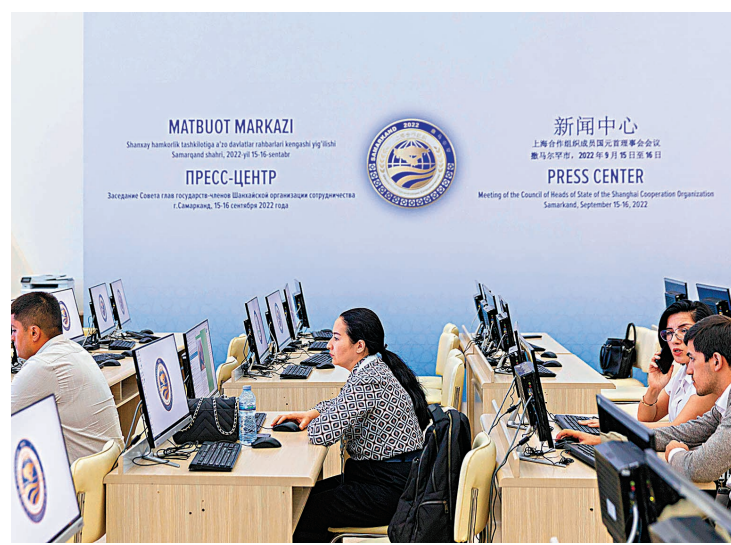
◆上合組織成員國元首理事會傳媒中心。

上海合作組織秘書長張明近日受訪時表示，國際社會廣泛關注上合組織本次撒馬爾罕峰會，大家共同期待上合組織成員國攜手一致，為全球合作注入「上合正能量」。