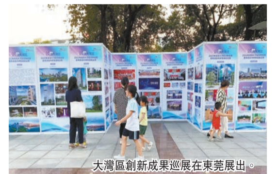
大灣區創新成果巡展在東莞展出。

從港莞合作互利共贏、科技創新先進製造、「雙萬」城市活力東莞、融通大灣區等四個方面，展現成長軌跡、當下的活力及與大灣區城市在產業協作、城市融合、交通銜接等多個方面「硬聯通、軟聯通、心聯通」的蓬勃圖景。 冷運軍