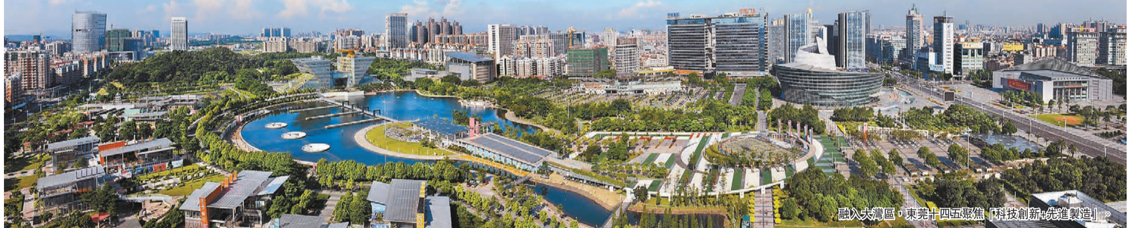
融入大灣區，東莞十四五聚焦「科技創新+先進製造」。

金秋八月，丹桂飄香。沐浴秋日旭陽的嶺南莞邑，一場以「融通大灣區」為主題的「2022粵港澳大灣區創新成果暨粵港合作輝煌成就巡展」正在上演。作為粵港澳大灣區的製造業名城，東莞在此次巡展中，分別